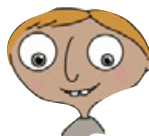
POJKEN MED FEM BRÖD OCH TVÅ FISKAR