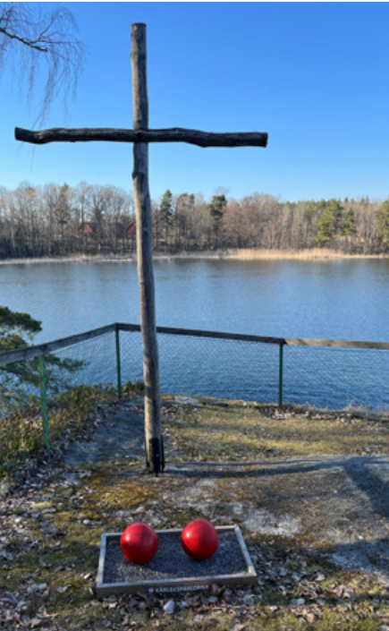
Frälsarkransens kärlekspärlor på Vårdnäs stiftsgård, Brokind.

sådant finns. På långfredagen är altaret klätt i den svarta färgen och stämningen är dämpad. Ofta sjungs psalmerna utan orgel eller med dämpat ljud. Jesus läggs i graven, ligger där under påskaf-ton och på påskdagen uppstår han. Då är det kvinnorna som upptäcker att Jesus inte längre ligger i sin grav. På annandag påsk möter några lärjungar Jesus på vägen till Emmaus.