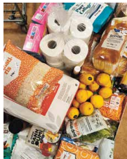
Vagnen fylls medan gästerna handlar i butiken, och i pausen fylls hyllorna på med nya varor.

Emmett hoppas på både fler sponsorer och fler butiker som vill skänka.