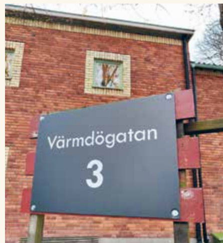
Skafferiet ligger en trappa upp i Kyrktrian, Värmdögatan 3.