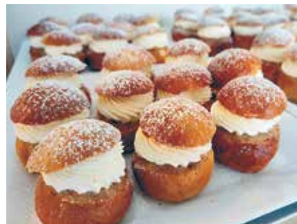
Husmors hembakade små semlor var en av dagens höjdpunkter.

– Det är alltid god soppa, men framförallt är det trevligt att äta tillsammans, säger hon. Jag brukar laga soppa hemma också, men det är mycket roligare att komma hit och få sällskap.