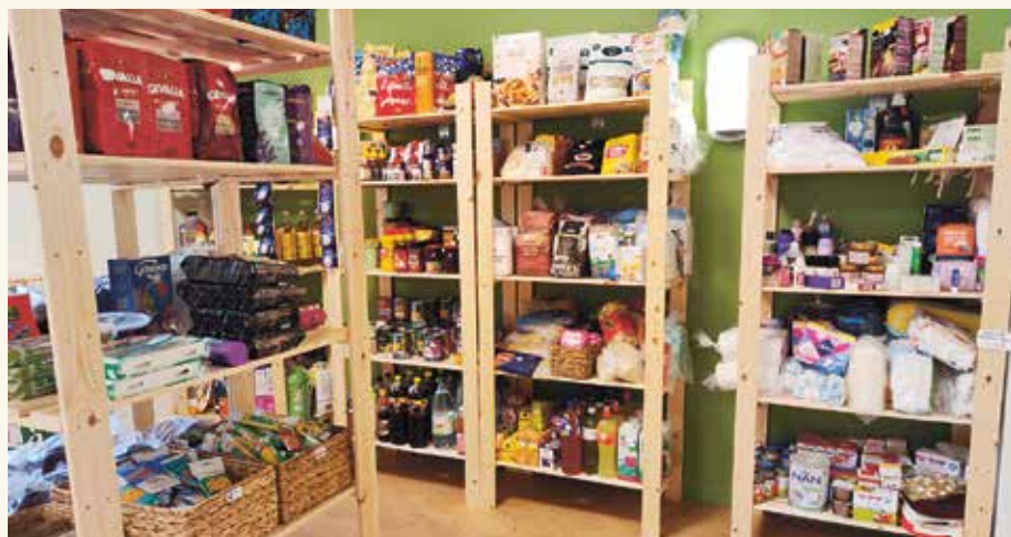
Hyllorna i butikslokalen är välfyllda med varor. Här finns också kylvaror och frysbox. Alla produkter kommer från samarbetspartners i Värmdö kommun som skänker svinnvaror till försäljning i Skafferiet.

www.atbart.org/svenska-matbanksnatverket