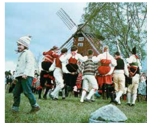
Midsommarfirande på Kvarnbacken – både materiellt och immateriellt kulturarv.