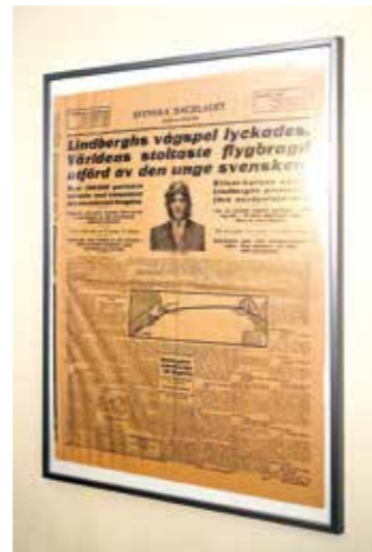
Artikel om Charles Lindberghs atlantflygning.