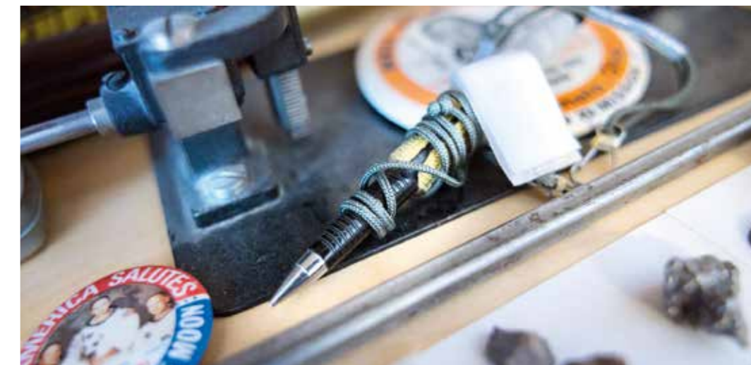
Den penna Christer Fuglesang använde under sin rymdfärd.