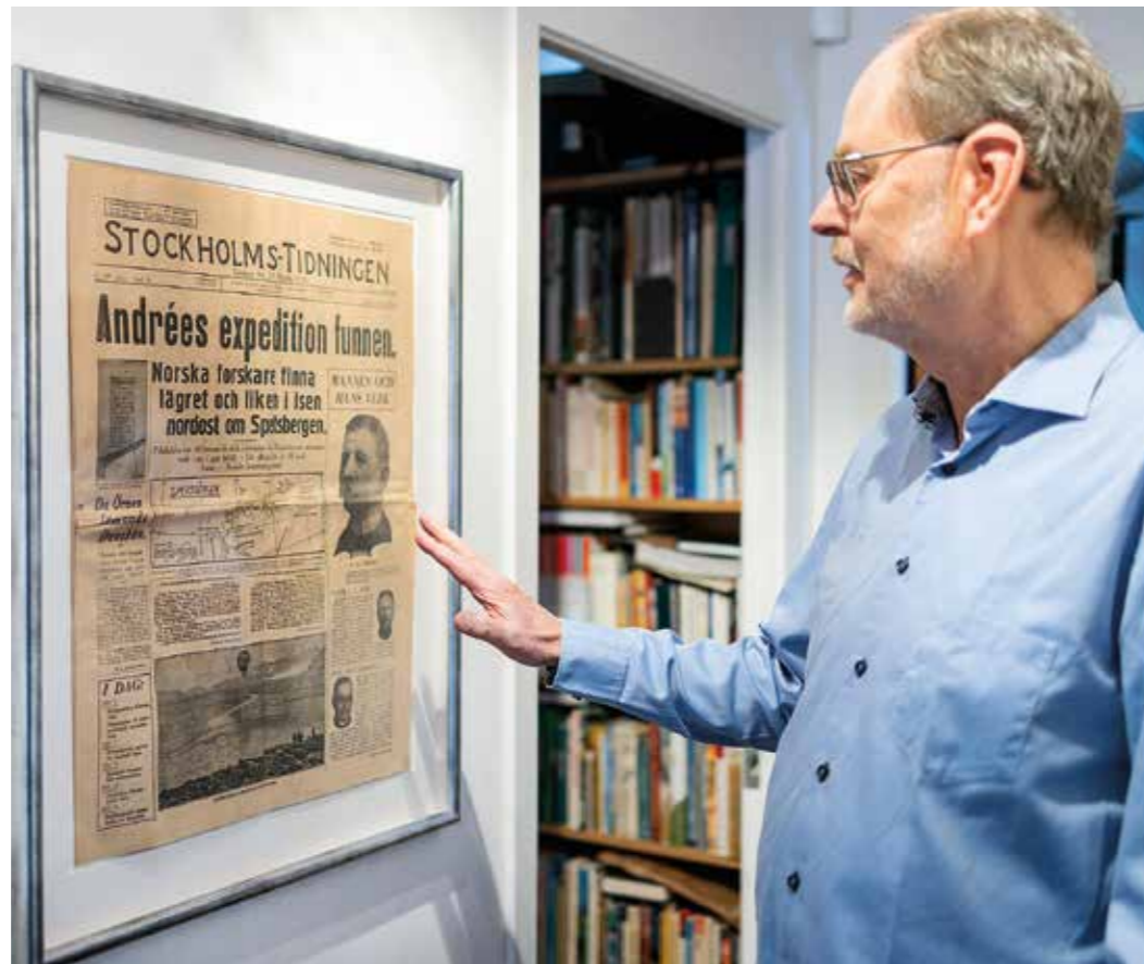
Clas har ett stort allmänintresse. Här med en inramad artikel om Andrées polarexpedition.