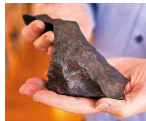
Del av en meteorit som slog ner i Arizona för 50 000 år sedan. Då bildades Barringerkratern, 1 200 meter i diameter och 170 meter djup.

TEXT: PER AXEL NORDFELDT