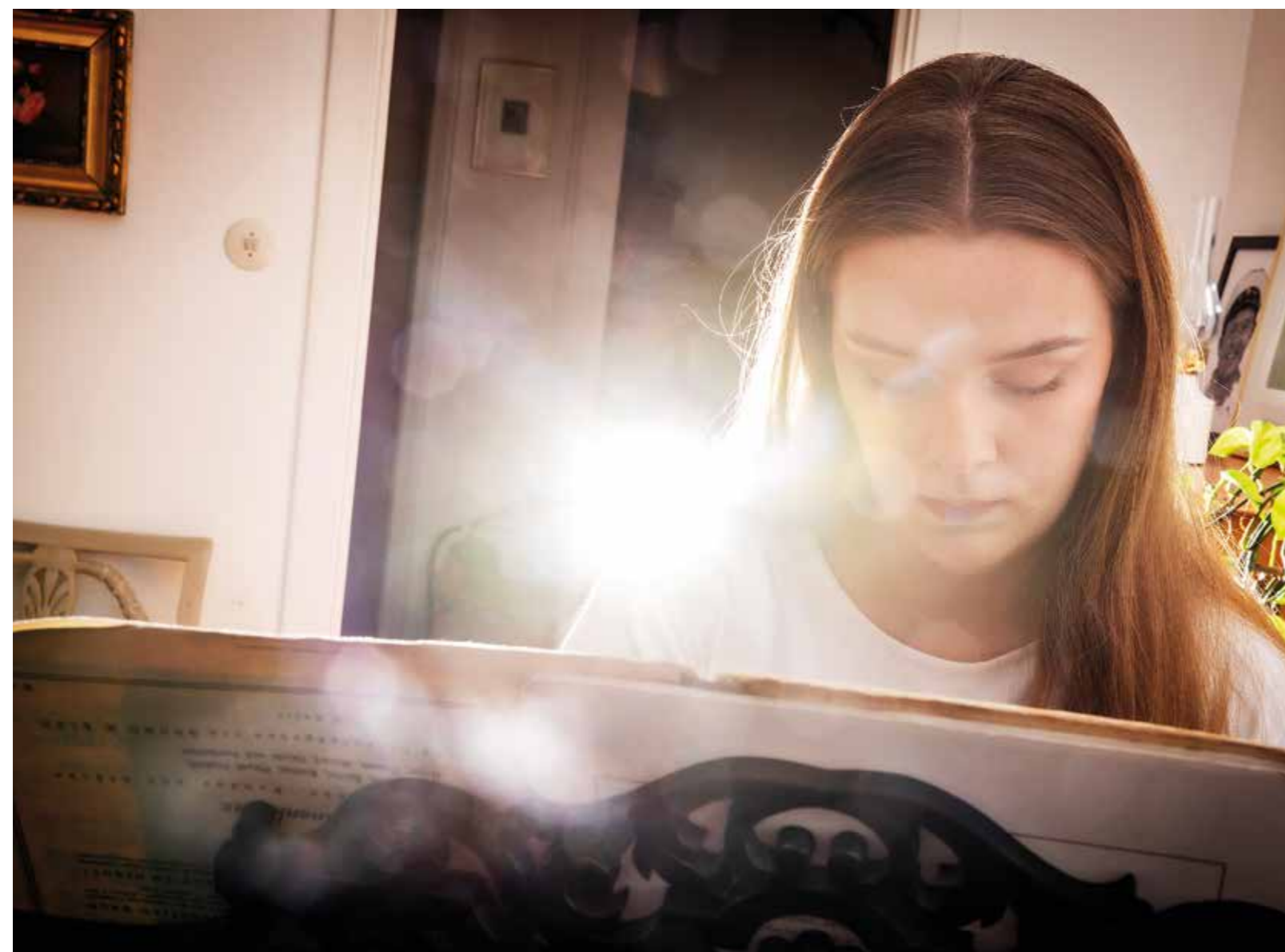
Arbetet innebär mycket mer än sång, bland annat instudering av musiken vid pianot.