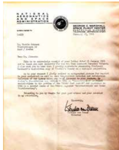
Personalia ur arkivet: brev från forskaren Wernher von Braun.