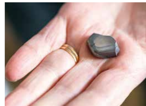
Del av metallstycke som hittades efter en ufo-observation på Vaddö 14 oktober 1956. Två snickare mötte ett lysande objekt som svävade över deras bil, som fick motorstopp. När föremålet flugit iväg hittades metallstycket på vägen.

– Det är ett problemområde i Norrköping, berättar Clas. Kommunen vill satsa. Tanken är