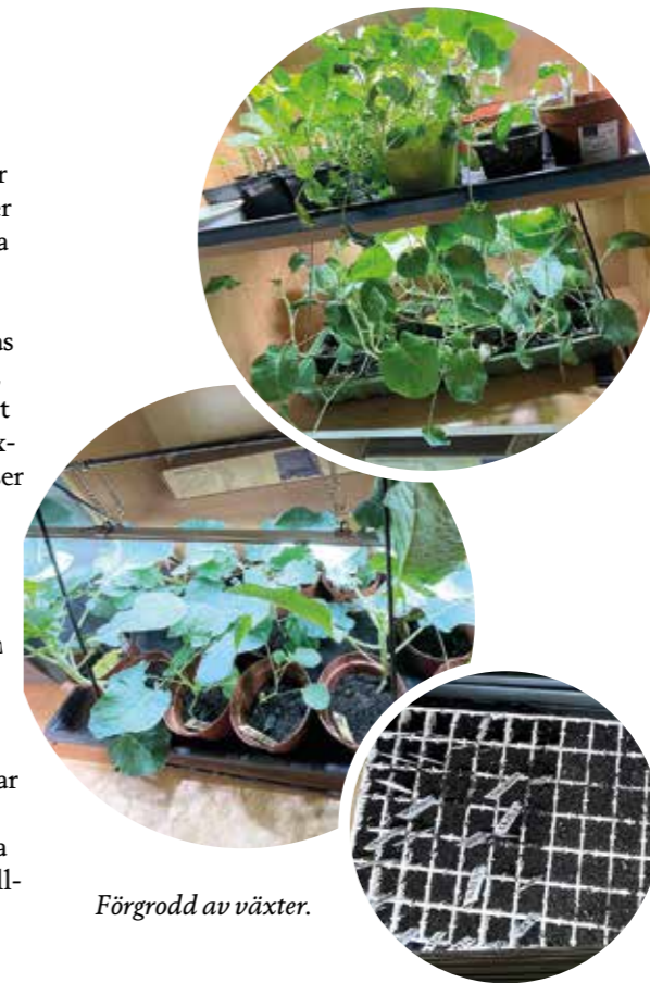
Förgrödd av växter.

Hör av dig till ulrika.ingermark@svenskakyrkan.se