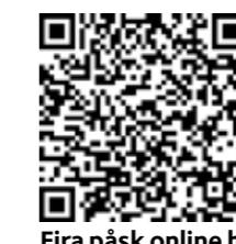
Fira påsk online här!