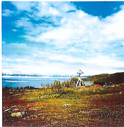
Saltoluokta kyrkköta samt Staloluokta kyrkplats, där gudstjänster firas sommartid