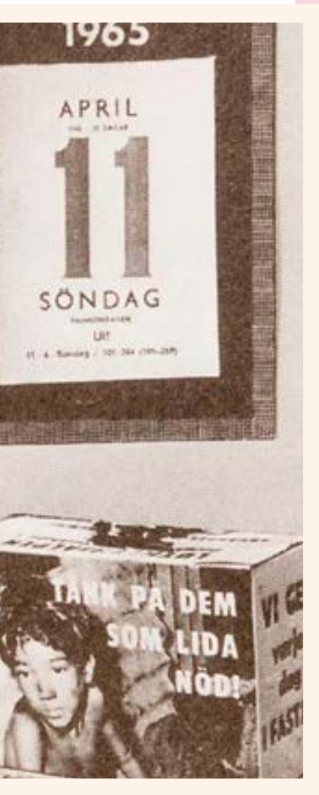
första 50 år av Björn Ryman