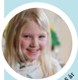
Selma 5 år

Ville: De åt mat, kanske falukorv och makaroner, det är min favvis. Sen skulle han hängas upp på ett kors.