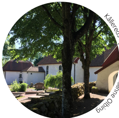
Kållereds kyrka.

*Vi ordnar även resa 4 juni till Asperö (endast kvinnor) och 28 augusti till Sammels lantgård.