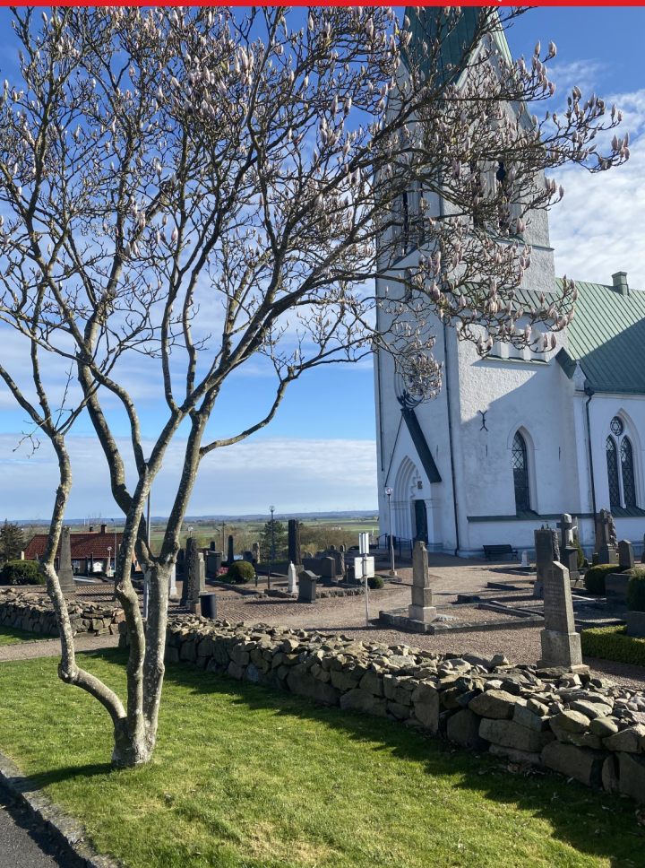
Björnekulla kyrka en vårmorgon i april.