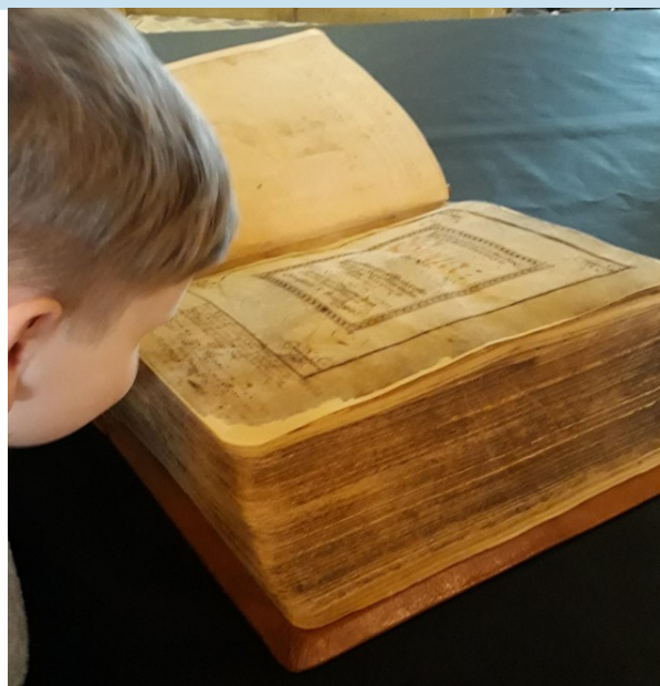
Hur doftar en Bibel från förr?

Låt oss få hjälpa er med gravskötsel på era gravar, vi erbjuder 1-årsavtal och avräkningsavtal, nedan priser avser per kalenderår.