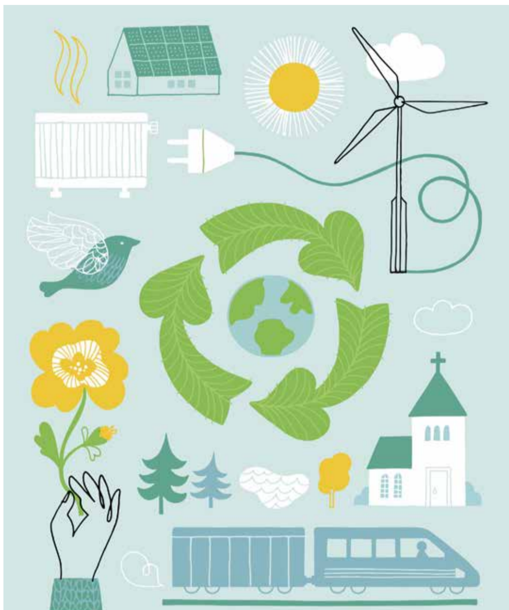
ILLUSTRATION: SUSANNE ENGMAN

3 december 2020 gick Botkyrka församling i mål i den första etappen i arbetet för miljö och hållbarhet och församlingen miljödiplomerades. Sedan 2020 är Botkyrka församling miljödiplomerade. Genom både praktiskt och andligt hållbarhetsarbete vill vi visa vägen till det goda och hållbara samhället.