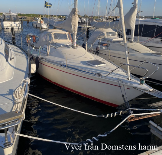
Vyer från Domstens hamn