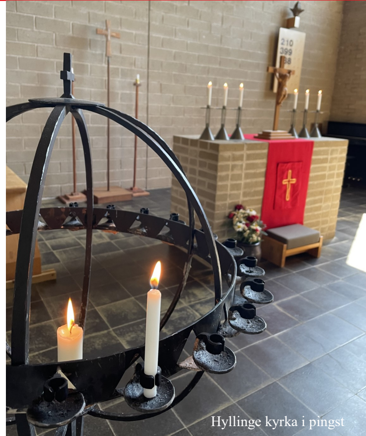
Hyllinge kyrka i pingst