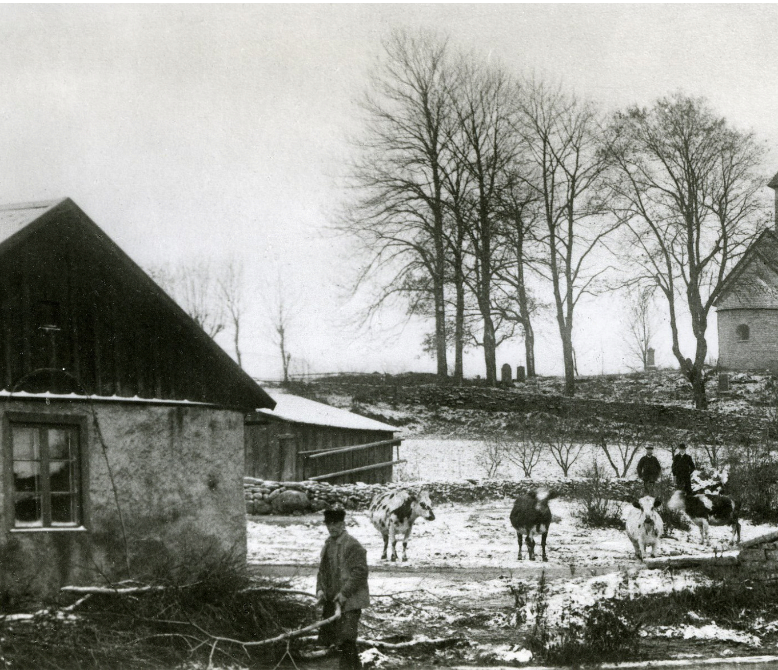
Bild: Våmb's kyrka och stenvalvsbron över Våmb'sbäcken 1910.