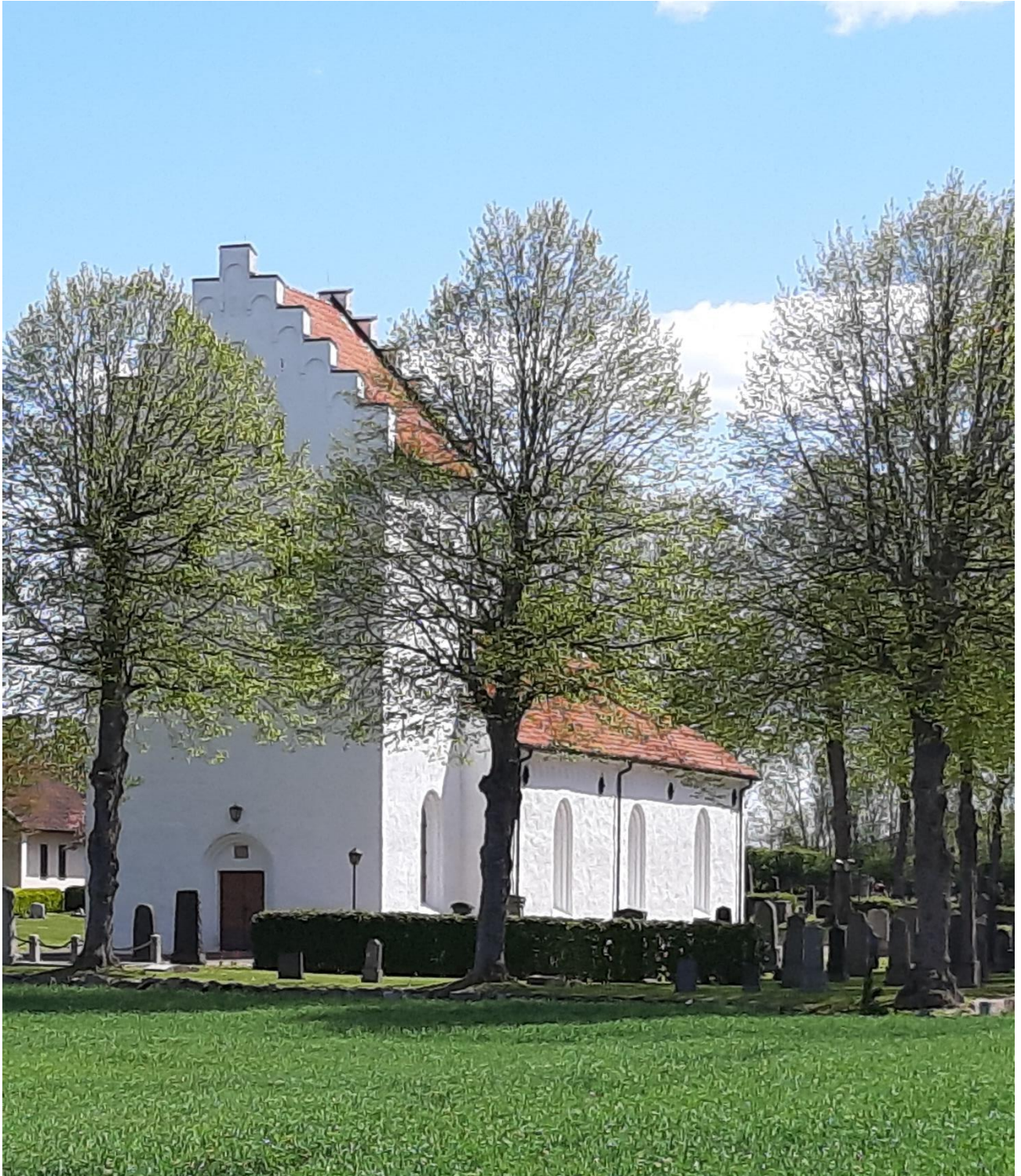
AUSÅS KYRKA I Strövelstorps församling, Lunds stift

En kort historik och beskrivning av dess inventarier