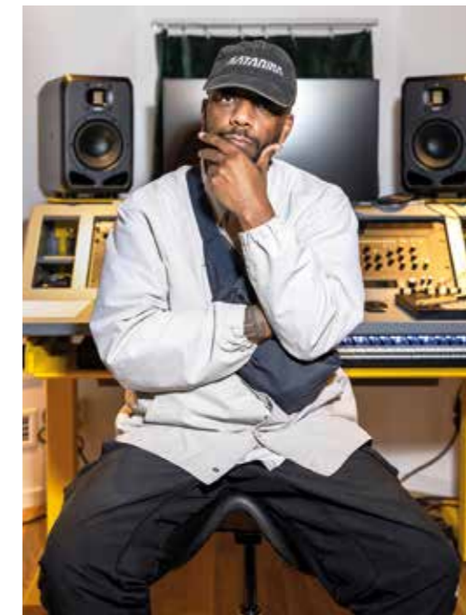
Tänker ut nya planer.

Här kan man läsa mer om Katarina Cup: www.j-rn.com