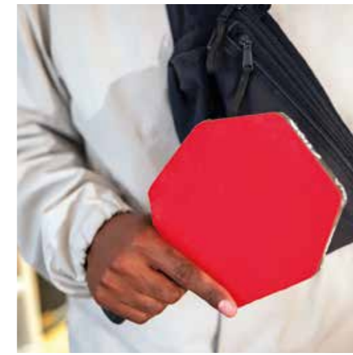
Senaste design inom pingpongcracketar.

– Min musik utvecklas hela tiden. Jag vill aldrig göra två album som låter likadant. Jag vill utmana mina lyssnare.