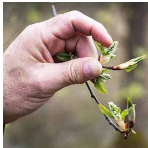
Sälgen är en av de första träd som blommar.