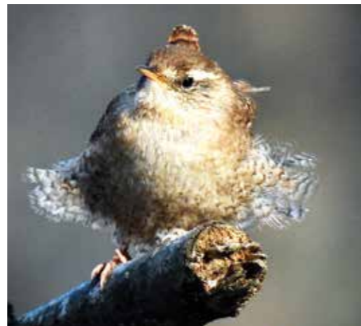
Gärdsmyg. Liten fågel, stort läte.