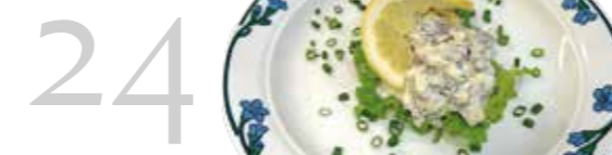
Händer i Järfälla sid 20