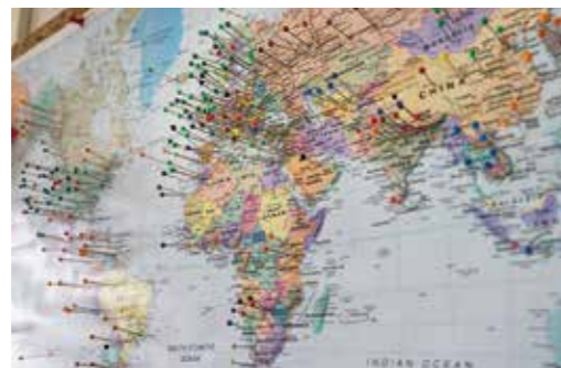
En nål för varje plats Max besökt.