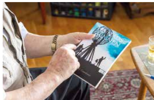
I boken Levnadsminnen har Max skrivit ner sina hägkomster

TEXT: PER AXEL NORDFELDT