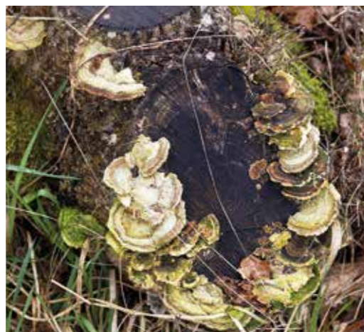
Svamponanza!. Björkmussligen har fest på en stubbe.