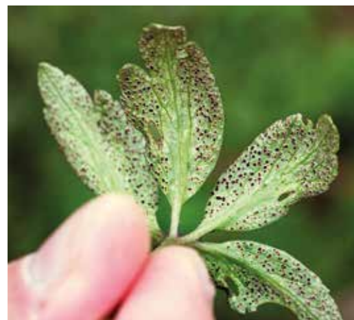
Sipprostens mörka prickar på vitsippbladets undersida.