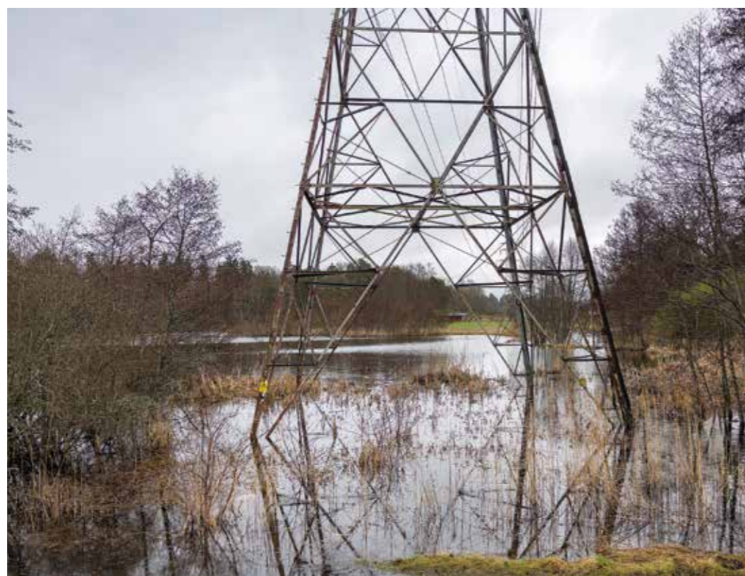
Vid Lappkärrsbergets öppna vattenyta har många arter hittat sin plats.

det av godo. Demonstrationerna har fått oss att diskutera våtmarker som aldrig förr. Det har ökat medvetenheten om viktiga miljövärden.