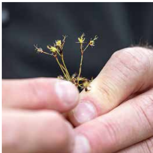
Vårfryle, favorit med sparsmakad design.