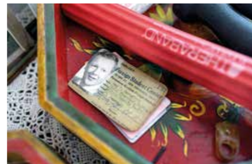
Certifikat för universitetsstudier i USA