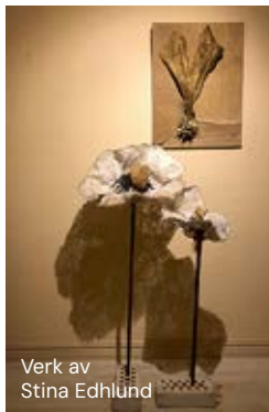
Verk av Stina Edlund

Medlemmar från Hammarö konstförening ställer ut på Hammars gård, den vita byggnaden alldeles intill Hammarö kyrka. Utställningen pågår från 26 juni till 4 augusti och är öppen samma tider som kyrkans sommarcafé.