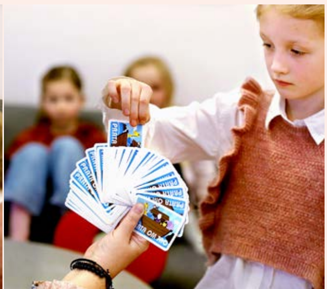
I församlingens verksamhet används olika verktyg för att möta barnen i samtal, till exempel frågekort. Men också formen ger nycklar till möten – pyssel, fikastunder och andakter kompletterar varandra.