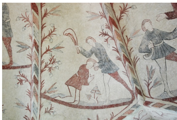
Västra långhusvalvet, överst från vänster: norr (Vällust och Frosseri), öster 1 (Utdrivandet ur Paradiset), öster 2 (Kain och Abel offerar), söder (Kain dräper Abel samt Gud frågar Kain var Abel är).