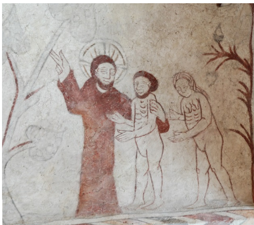
Gud förevisar Kunskapens träd för Adam och Eva.

Mellersta långhusvalvet, överst från vänster: norr (Adam och Eva upptäcker sin nakenhet, Eva spinner), öster (Adam gräver, Gud skapar Adam), söder (Gud skapar Eva, Guds vila), väster (Gud visar Kunskapens träd, frestelsen).