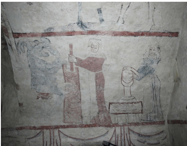
Västra sköldbågen, södra sidan: djävulen hjälper en kvinna att kärna smör