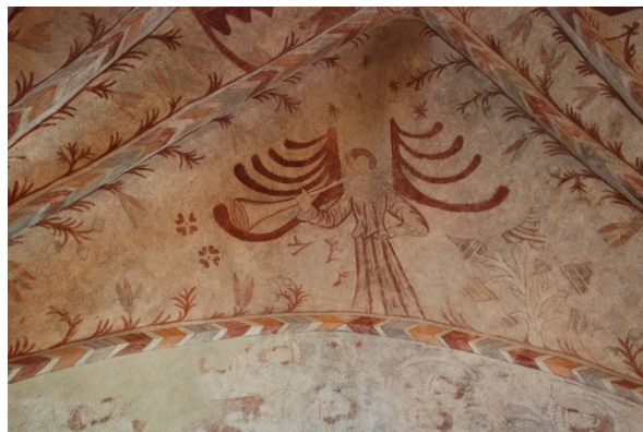
Korsmittens valv, överst från vänster: norr (Rosenkransmadonnan), öster (Kristus som Smärtomannen), söder (S:t Olof och S:t Erik), väster (ängeln Gabriel med basun). Bilder från valvhjässan saknas.