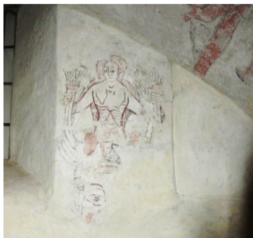
Västväggen, norra sidan: en sirén, kvinna med två fiskstjärtar som enligt Lindqvist ska symbolisera hedendomen och kätteriet.