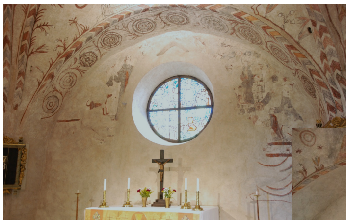
Östra och södra korväggarna