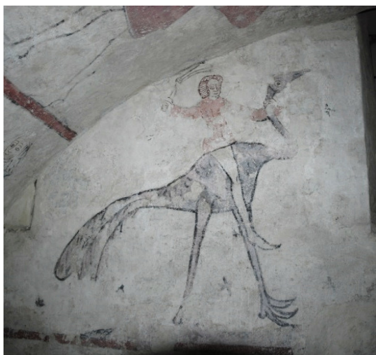
Västväggen, södra sidan: en man som rider på en struts (dödssynden Vankelmodet)