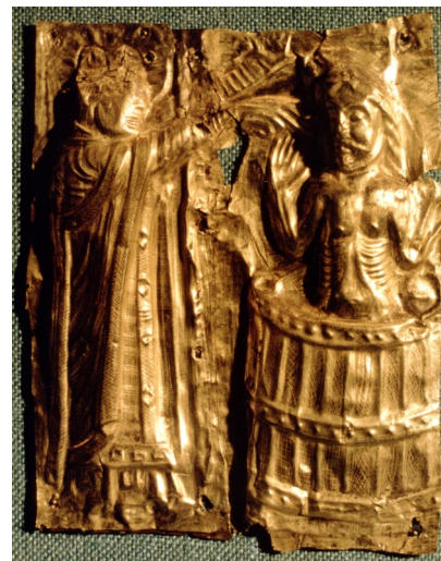
Bild 3 Harald Blåtands dop i en träfunt avbildad på Tamdrupaltaret. Nationalmuseet Köpenhamn.

Denna bearbetade kalkstenshäll observerades på Hajdgårde, bild 1 , och flyttades 2014 till kyrkans parkeringsplats där den idag är placerad utefter västra utsidan av kyrkogårdsmuren, bild 2 . Hajdgårde ligger tre km fågelvägen söder om Hejde kyrka. Området har varit bebott sedan äldre järnålder.