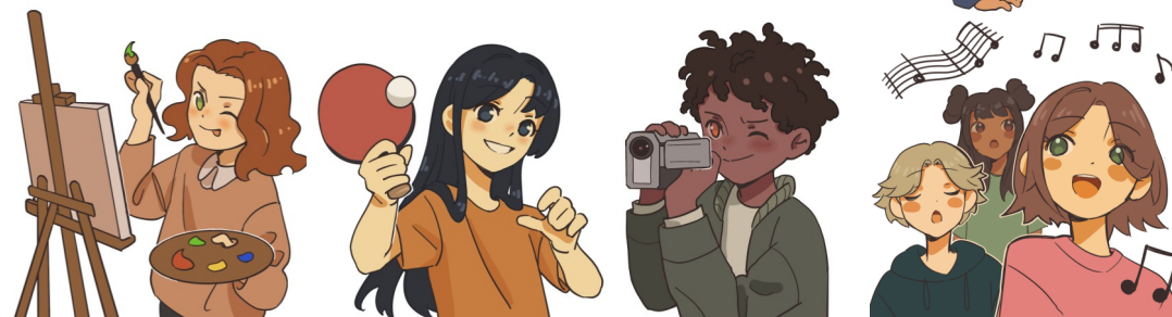
Illustrationer: Dorothea Malmros