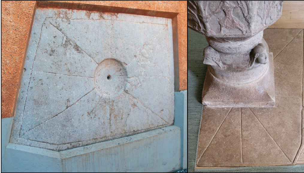
Bild 4. Stenhäll inmurad i fasaden på Hejde prästgård.

Den funna stenen liknar några andra stenar i närheten. En sten sitter inmurad i fasaden på Hejde prästgård, bild 4 , en utgör underlag till Väte kyrkas dopfunt, bild 5 . Bägge har ett avfasat hörn. Liknande stenar ligger i Hellvi kyrka samt i Stånga kyrka.