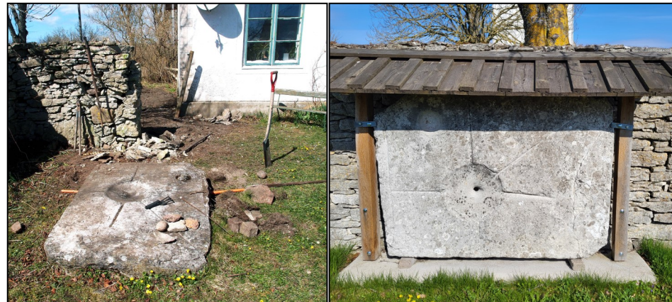
Bild 1. Stenhäll på fyndplatsen på Hajdgårdes "lillgard", inför flytten till Hejde kyrkas parkeringsplats.