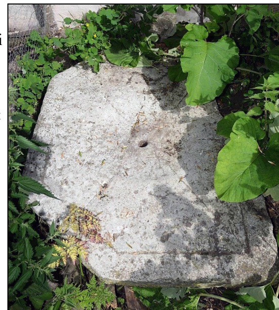
Bild 6. Stenhäll på Stora Velinge, Buttle.

Gutasagan säger att köpmän reste till kristna länder, somliga lät döpa sig där och förde med sig kristna präster till Gotland. Det äldsta kyrkobyggandet på Gotland tycks helt ha skett på privat initiativ. Enskilda storbönder och farmän antog den kristna tron och tros ha byggt sig ett gudshus på sin gård. Först när allt fler kyrkor byggdes i sten reglerades kyrkornas antal, i vissa fall kanske genom att nya sockenkyrkor delvis ersatte flera gamla gårdskyrkor. Det är möjligt att Hajdgårdes innevånare var tidiga med att bygga en gårdskyrka i vilken vuxendop förrättades i ett träkärl ovanpå en dophäll i sten. Samma sak kan ha skett på gårdarna i Norrlanda, Atlingbo och Buttle. Kanske gäller det även de äldre gårdar som sedan blev medeltida prästgårdar i Hejde, Öja och Bunge?