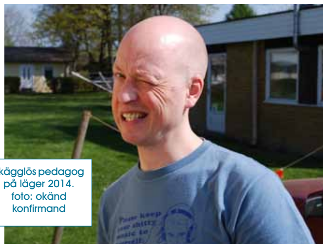
Skägglös pedagog på läger 2014.