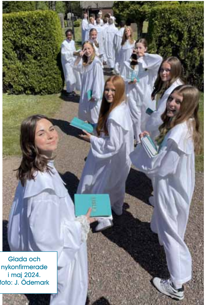
Glada och nykonfirmerade i maj 2024.

Vi avslutar med konfirmation den 5 juli. Träffarna innehåller bland annat diskussioner och teman, utflykter och upplevelser, film och skapande. Sommargruppen åker också med på resan tillsammans med veckokonfirmanderna.