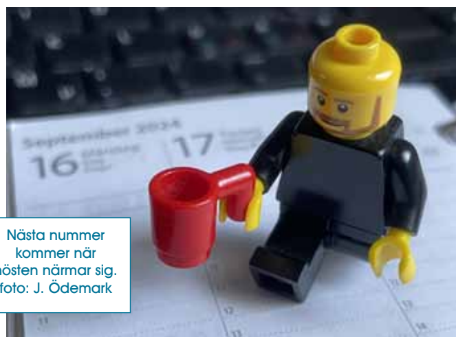
Nästa nummer kommer när hösten närmar sig.