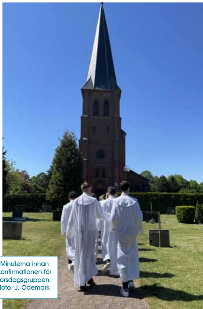
Minuterna innan konfirmationen för torsdagsgruppen.