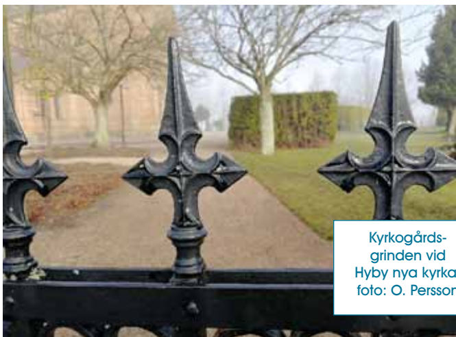
Kyrkogårdsgrinden vid Hyby nya kyrka.