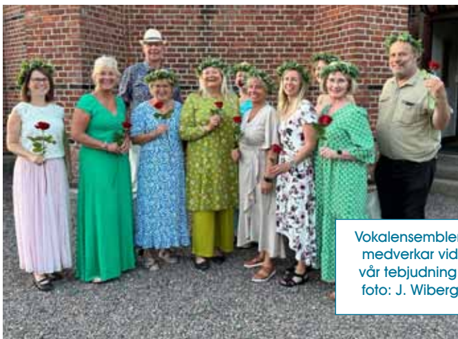
Vokalensemblen medverkar vid vår tebjudning.