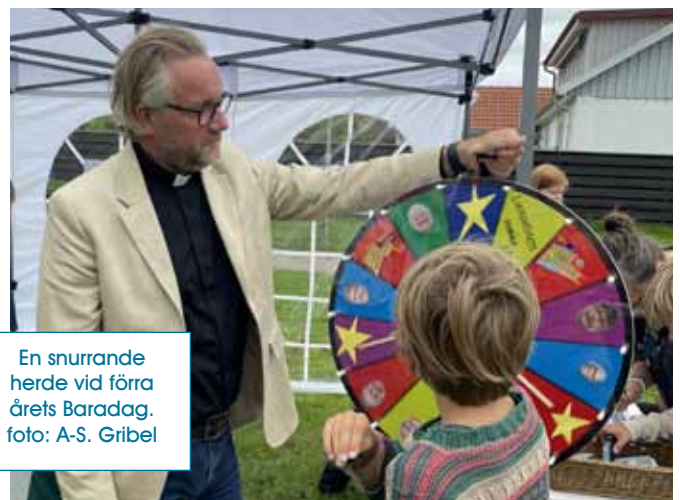
En snurrande herde vid förra årets Baradag.