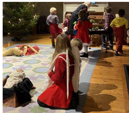
Levande julkrubba på julafton i Järnskogs kyrka.