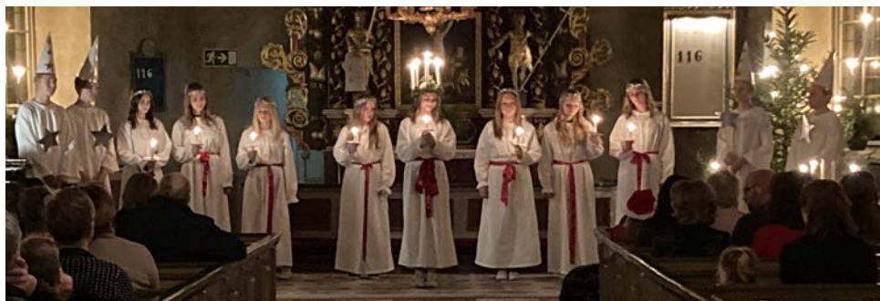
Luciafirande med konfirmanderna i Järnskogs kyrka