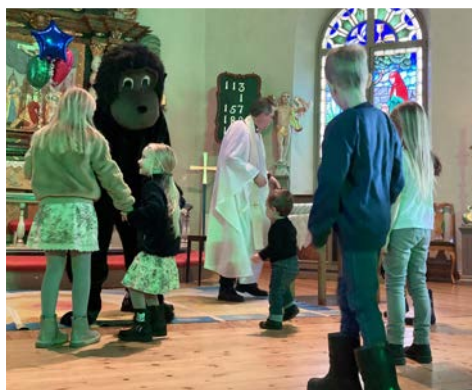
Familjefest med Diamaterna och apan Sköje i Köla kyrka och efterföljande kalas i församlingshemmet.