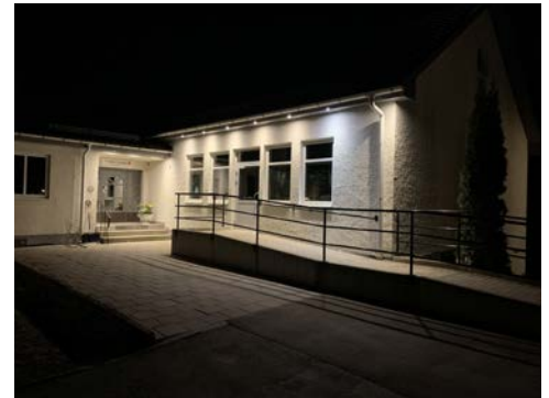
Den nya fasadbelysningen sprider sitt sken över planen framför entrén vid Köla församlingshem.