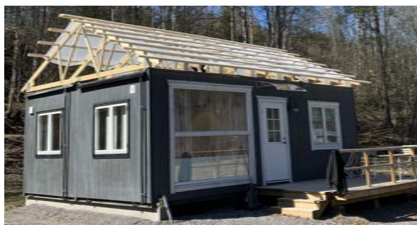
Takstolarna har rests på det nya vaktmästeriet i Skillingmark där vatten och avlopp är på väg att installeras.