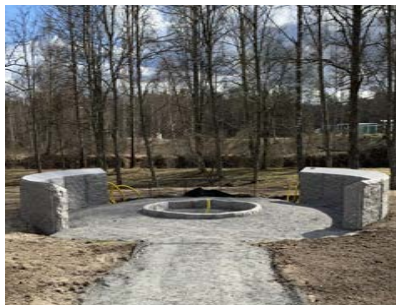
Askgravlunden i Köla går mot sin fulländning. De sista finjusteringarna stundar med inkoppling av belysning samt fyllning av matjord och plantering av perenner.