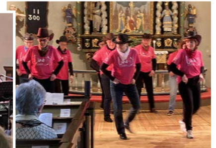
En mörk marskväll var det dansbandsgudstjänst i Köla med Remicks orkester, Line Ladies och tillhörande mingelförfriskningar