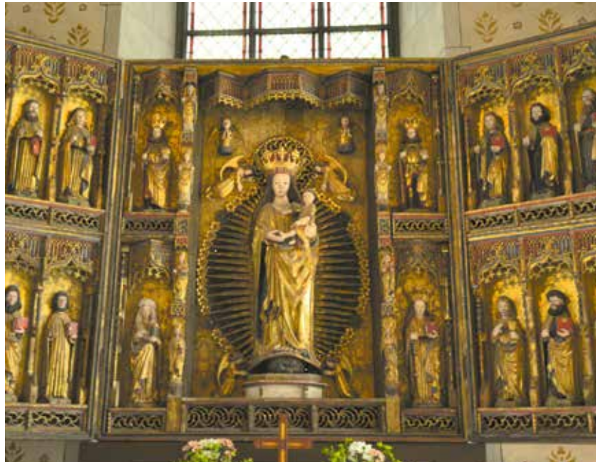
Altarskåpet med den krönta Maria i mitten med Jesusbarnet i famnen är till skillnad från de flesta samtida tysktillverkade altarskåpen gjord i Sverige.

17 juni t o m 1 aug söndag – torsdag 9.30–16.30. MG