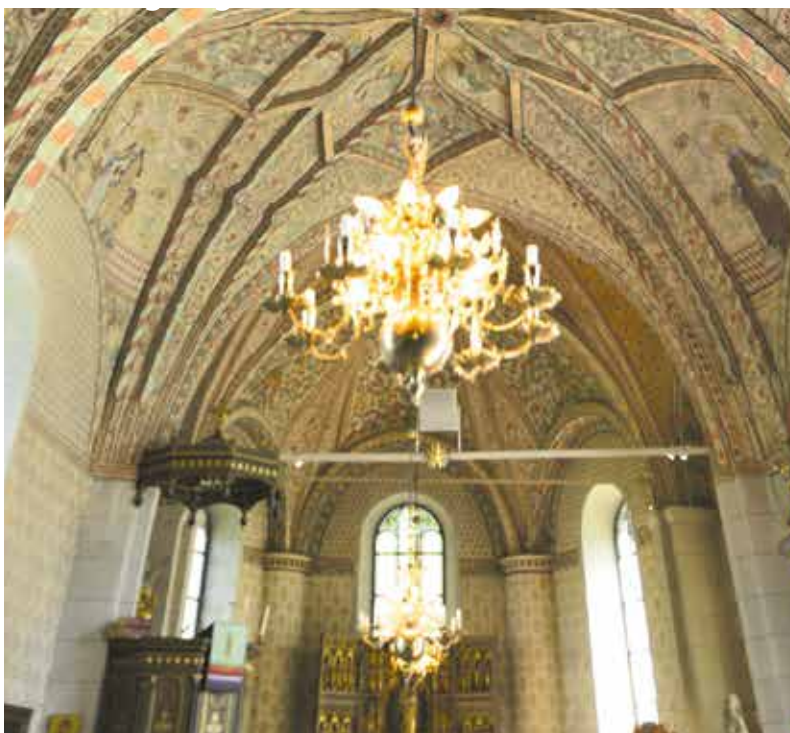
Vackra takmålningar i Älvkarleby kyrka.