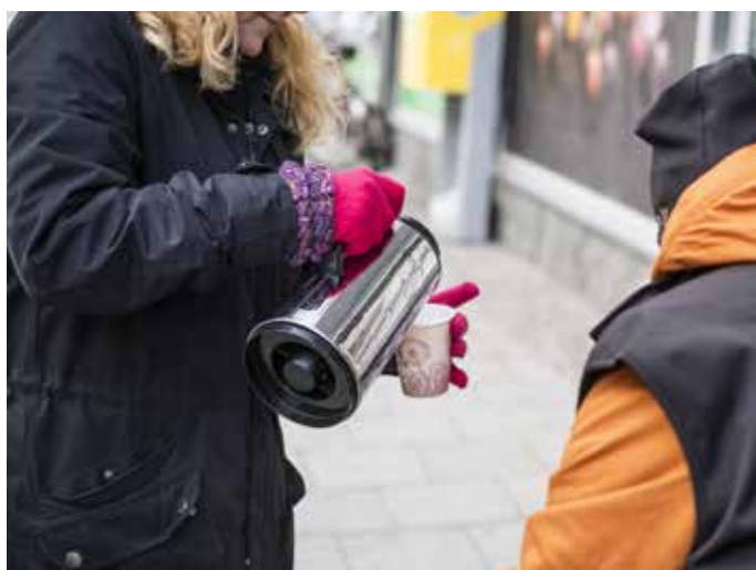
JOHANNES FRANDSEN / IKON

Svenska kyrkan är en bra plats att engagera sig ideellt på. Antingen frågar man vad som behövs eller kommer med egna tankar. Steg ett är att höra av sig.