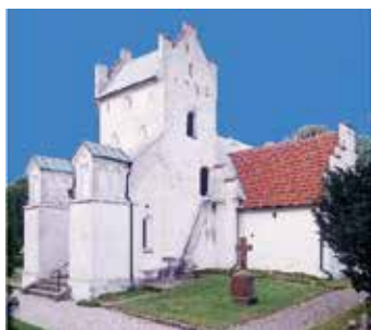
Stora Råby kyrka Stora Råby byaväg 7 224 80 Lund