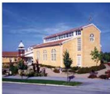
Maria Magdalena kyrka Flygelvägen 1 224 72 Lund