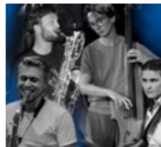
Jazzkvartett Gullin 4.

Sommarmusik Under juli och augusti inbjuder vi till "Musik i sommarkvällen" i våra kyrkor i Östergarn, Kräklingbo och Gammelgarn. Om inget annat anges är det fredagskvällar kl. 19.30 som gäller för dessa musikaliska höjdpunkter. Inget inträde men gärna en frivillig gåva till musikverksamheten. Mer information kommer att finnas på webbsidan "Livet på ön" och på Östergarnslandets anslagstavla på Facebook.