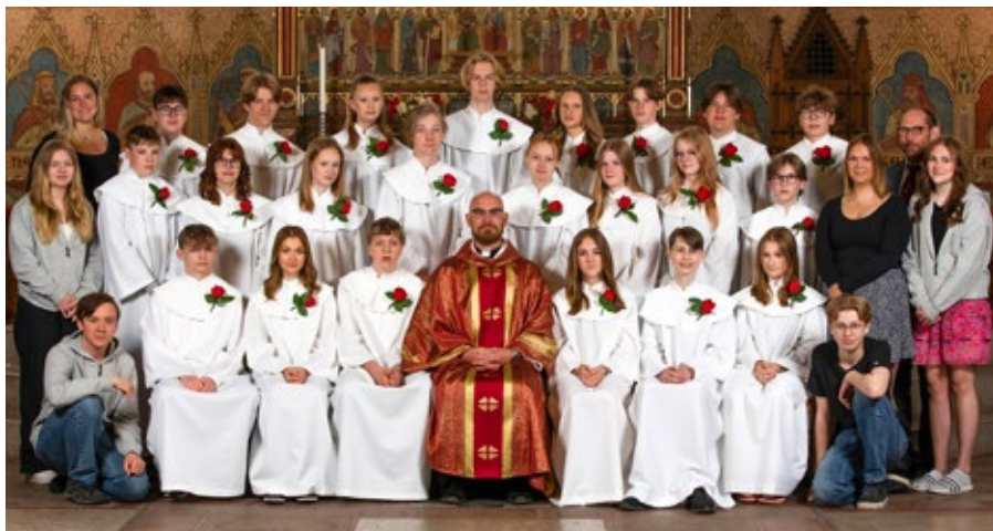
Konfirmander i Romaklosters pastorat 2024.

25 konfirmander, 16 unga ledare, 5 vuxna ledare och 1 busschaufför. Lördagen den 25 maj konfirmerades 24 av konfirmanderna. Den sista konfirmeras vid en senare tidpunkt.