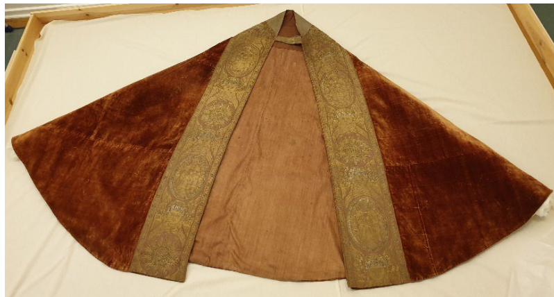
Lika guldbräm på mässhake, Fellingsbro kyrka, och på korkåpa, Nikolai kyrka.

Hur kan det komma sig att ett till synes identiskt guldbräm hamnat på en korkåpa i Örebro och på en mässhake i Fellingsbro? Har dessa kyrkor några särskilda kopplingar som vi förbisett? Kan de komma från samma donator ursprungligen?