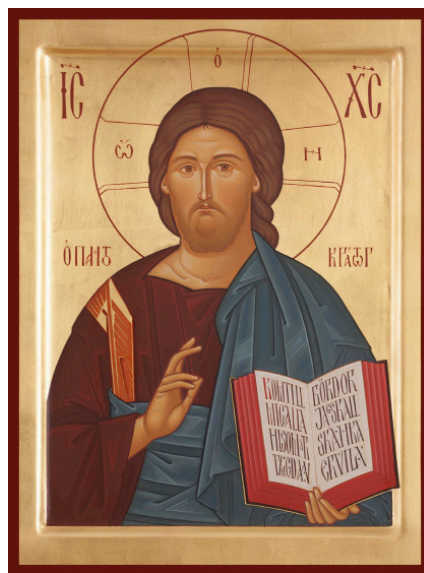
Ikoner målade till Prästgården i Algutstorp av Robin Johansson

Med reservation för eventuella ändringar.