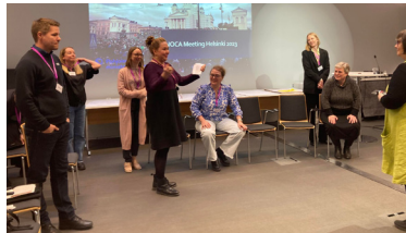
Noca-möte i Helsingfors mars.