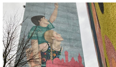
Om MR, demokrati och teologi 17-18/1.