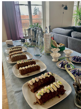
Tårtorna på dopkalaset 4 februari 2024

Den 4 februari hade vi familjegudstjänst med dopängelutdelning och vi gav barnens bästa bibel till alla femåringar. Så klart ville vi ha ett riktigt kalas i församlingshemmet efteråt! Vi bad våra tjejer om hjälp och de ställde självklart upp. Så på lördagen bakades det tårtor och 50 ballonger blåstes upp. På söndagen kom de tidigt till församlingshemmet för att pynta både tårtor och lokalen. Vilket kalas det blev! Med fiskdamm, lek, bus och sång.