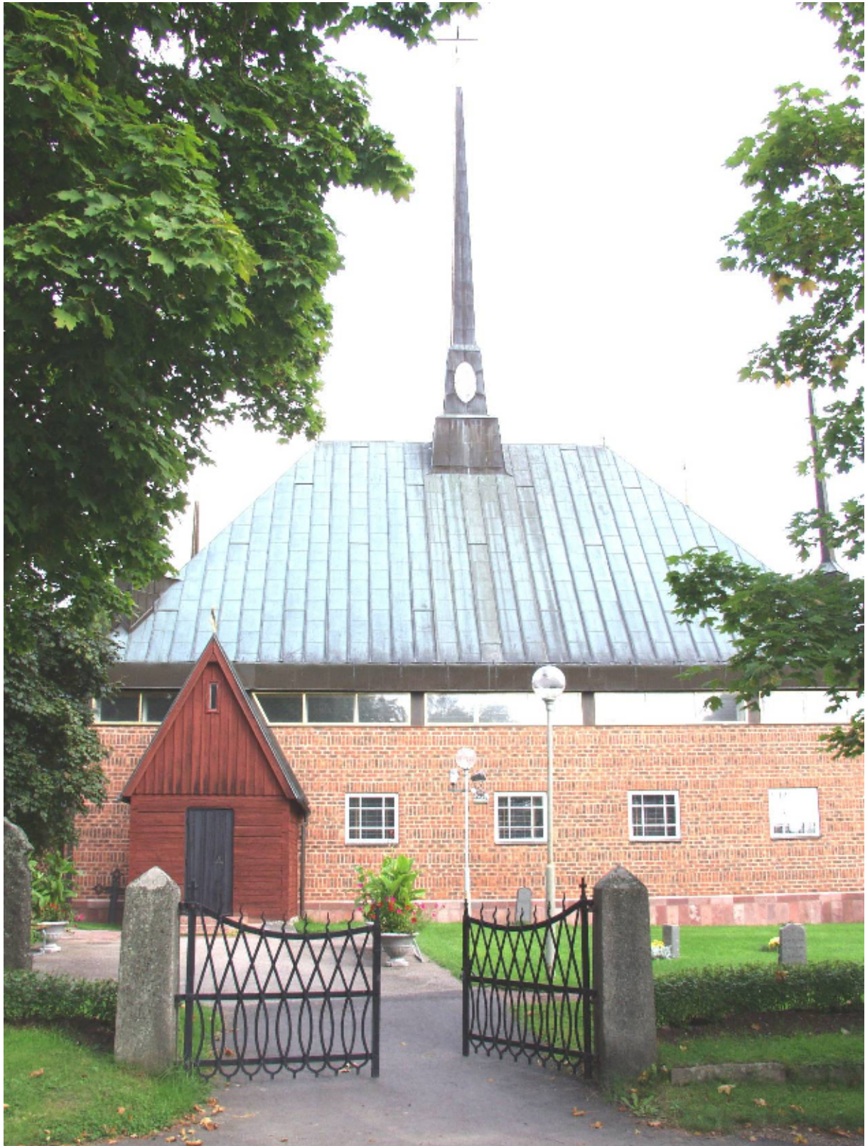
Aspeboda kyrka i augusti 2005 – digitalfoto Jean-Paul Darphin