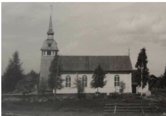
Bild av kapellet då det hade 1881 års fasadpanel.

Vid upprustning 1881 blev kapellets ytterväggar klädda med en spåntad panel, stående till fönsterhöjd och ovanför liggande, vilken målades med vit oljefärg. Även invändigt målades vitt på altare, predikstol och orgelläktare. En mer omfattande, öppen bänkinredning tillkom, vilken ådrades. I första hälften av 1890-talet fick kapellrummet sina första värmekällor, två järnkaminer. En läktarorgel som tillhört Svärdsjö kyrka kom på plats 1906. Runt orgelverket från 1738 byggdes en ny fasad av lokale snickaren Jonas Nylander.