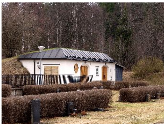
Bårhuset används numera mest som ekonomibygnad för kyrkogårdsförvaltningen.

Nordost om kyrkan, vid tomtgränsen, ligger ett bårhus med redskapsbod uppförd 1957 efter ritningar av arkitekt Tore Virke. Byggnaden är uppförd av lättbetong med vitputs, under brutet svart plåttak, som delvis täcks av torv.