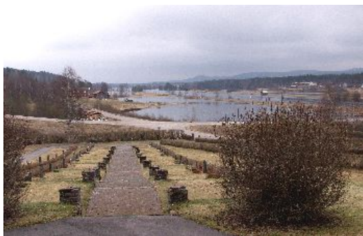
Västra kyrkogården

Karakteristiskt för kyrkotomten är de axiala alléerna som delar kyrkogården i östra och västra kvarter. Alléernas axel är anlagd i nordsydlig riktning, och ansluter dels till kyrkans södra portal och dels till sakristian på norra sidan. Alléer löper även kring kyrkotomtens yttre gränser, innanför de yttre häckarna.