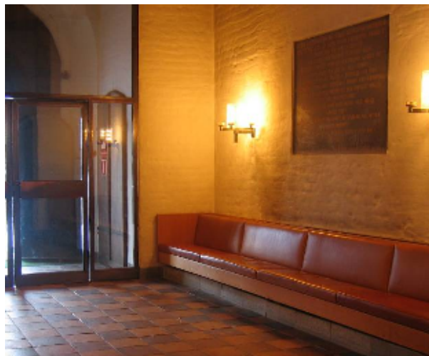
Vapenhuset nyinreddes 1967 efter arkitekt Gösta Lilliemarcks program

Vapenhuset har sedan förnyelse 1967 takpanel av klyvsågad, ljusst laserad furu. Väggarna är vitslammade. I golvet ligger tegelplattor samt en fris av grå, hyvlad Gustasten. Såväl mot kyrkorummet som mot ytterdörren finns glasade vindfång inramade av kopparklätt stål.