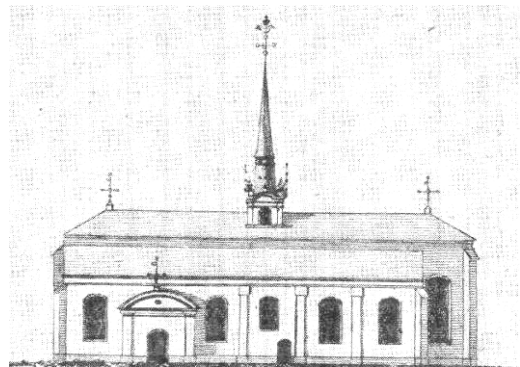
Kyrkans exteriör åren 1691 – 1757. Rekonstruktion av Eric Hammarström

Vid en stor utbyggnad 1684-86 fick långhuset dagens omfång, genom att de tre skeppen förlängdes österut med vardera ett valv. Koret byggdes till, med gavlar murade i vinkel likadant som på Kristine kyrka. Däremot revs de medeltida småtornen på långhusets strävpelare. Altarskåpet, korskranket och predikstolen flyttades österut i det utökade kyrkorummet. Altare murades invid den nya gavelväggen. Ytterligare en utbyggnad skedde 1691, då sakristians östliga kupolvälvda rum lades till. År 1698 flyttades orgelverket från gapskullen till en nybyggd läktare i väster.