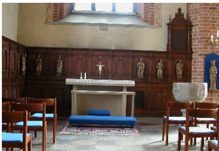
Höga brunbetsade väggpaneler binder samman koret med sidoskeppens främre delar.

Sakristian mitt på norra sidoskeppet är till sin västra del medeltida, täckt med två kryssvalv. Golvet är belagt med ekparkett. Möblerna från 1900 tillverkades av falusnickaren Axel Johansson. Över detta rum finns en kryssvälvd läktare av medeltida ursprung, ”gapskulle”, som öppnar sig mot kyrkorummet. Läktarbarriären av mörkbetsad furu uppsattes 1900. I sakristians östra del, tillbyggd 1691, är ett kupolvalv slaget och i nordost finns ett litet altare.