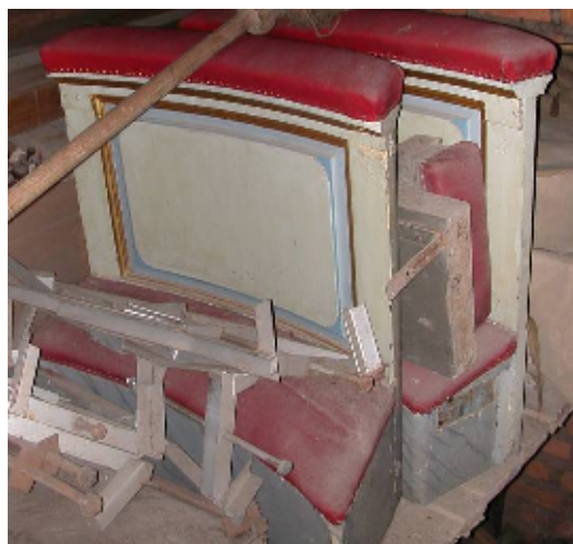
Altarringen från 1780 togs ur bruk 1900 men har sparats på kyrkvinden.

Då biskop Benzelstierna visiterade 1770 efterlystes en uppröjning av allt gammalt, som inte längre tjänade gudstjänstens behov. Bland annat föreskrevs att det medeltida altarskåpet borde avlägsnas. Så skedde vid en förnyelse av koret 1780, då även korskranket revs. En ny altarring av trä byggdes, med fyllningar och ramverk målade i vitt med blå lister. Predikstolen ommålades likadant och möjligen fick även bänkkvarteren en ljus färgsättning. Det murade altaret från utbyggnaden 1686 behölls, men inkläddes med trä som marmorades. Altarskåpet ersattes med en avsevärt större altarprydnad, ritad av Olof Tempelman. För att den skulle komma till sin rätt blev korets östra gavelfönster igenmurat.