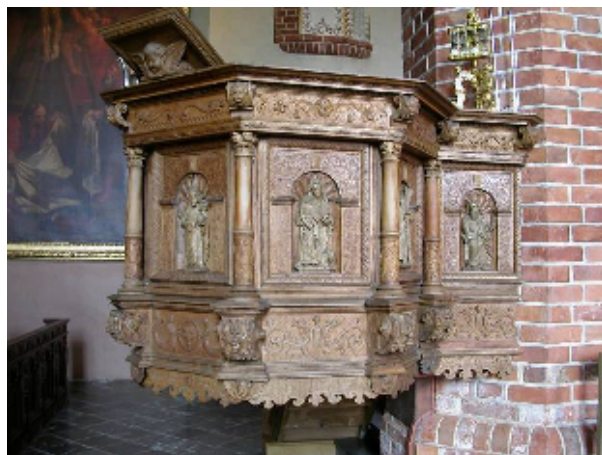
Predikstolen och i bakgrunden 1780 års altartavla