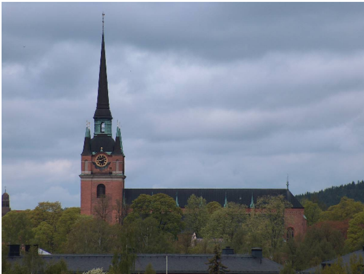
Stora Kopparbergs kyrka 2006-05-23

Falun 5:6, Stora Kopparbergs församling, Falu kommun, Dalarnas län