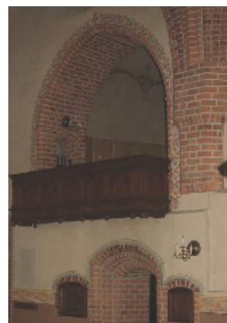
Gapskullen och sakristiportalen

Sakristian mitt på norra sidoskeppet är till sin västra del medeltida, täckt med två kryssvalv. Golvet är belagt med ekparkett. Möblerna från 1900 tillverkades av falusnickaren Axel Johansson. Över detta rum finns en kryssvälvd läktare av medeltida ursprung, ”gapskulle”, som öppnar sig mot kyrkorummet. Läktarbarriären av mörkbetsad furu uppsattes 1900. I sakristians östra del, tillbyggd 1691, är ett kupolvalv slaget och i nordost finns ett litet altare.