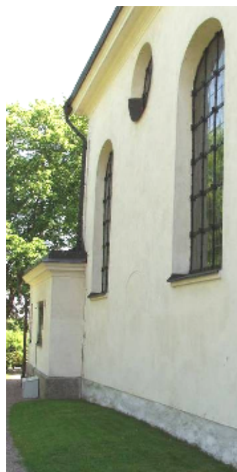
Norra sidan, med sakristian i bakgrunden

upp till fönstrens underkant. Tornets översta del består av gråsten uppblandat med tegel, långhusets övre murar och sakristian helt av tegel. Långhusets brutna, valmade tak täcks sedan 1986 av kopparplåt, tornets lanternin av äldre kopparplåt och längst upp av spån.