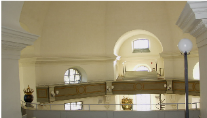
Den fasta inredningen domineras av ursprungliga inslag, tillkomna 1692-1703, men lamporna från 1957-58 sticker av.

Kyrkorummets centrala del upptas av två slutna bänkkvarter på ömse sidor om en bred mittgång. Den östra korsarmen är anordnad som kor, med sakristia i ett nedschaktat utrymme under altaret. I den södra korsarmen finns dopplats och i den norra ett musei- och musikrum. En högt belägen läktare, uppbyggen av snidade konsoler, löper runt kyrkorummet frånsett en öppning mot koret. Västra korsarmens bottenvåning är förhall och därför avskild med ett glasat parti.