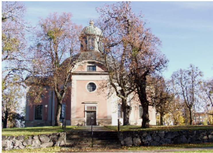
Kyrkans västra sida och framförvarande terrass

Kung Karls kyrka i Kungsör vid Mälarens västligaste del ligger högt uppe på en ås, sedan gammalt kallad Kungsörs backe. Kyrkan var från början vida synlig från sjön och den omgivande bygden. Genom att Kungsör på 1800- och 1900-talet utvecklats till betydande industriort ligger kyrktomten idag något mer skydd, mitt i tätortsbebyggelsen. Närmast angränsande hus är församlingshemmet Kristinagården, uppförd efter ritningar av arkitekt Jerk Alton och invigd i augusti 1990.