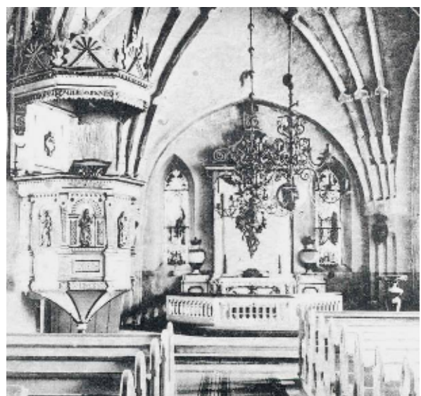
Kyrkorummet i början av 1900-talet – Digital kopia av äldre foto i Västmanlands läns museums arkiv

Inne i kyrkan borttogs de gamla ojämna tegelgolven och istället göts cementgolv. De nedre väggfälten målades med en mörk oljefärg, väggarna i övrigt och valvens kappor med vit limfärg. Som en kontrast målades grå limfärg på valvribborna. Öppna bänkar anskaffades och målades med oljefärg i grågul nyans - fast en mindre del av 1600-talets bänkkvarter tillvaratogs och magasinierades. Orgelläktaren utökades medan den norra så kallade knektläktaren revs. Predikstolen målades vit och blev rikt förgylld. I koret tillkom en ny genombruten altarring med skurna kolonner. Altarpuppas ommålades och sniderierna förgylldes. Kyrkorummet blev för första gången uppvärmt, sedan en vedeldad kamin installerats i norra skeppet. Tre år senare fick korfönstren glasmålningar.