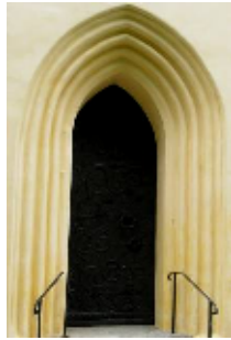
Digitalfotografier Rolf Hammarskiöld