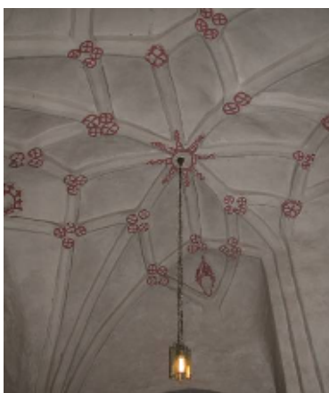
Vapenhusets målningar restaurerades 1932

Vapenhusets valv och väggar är dekorerade med röda åttauddiga stjärnor, flätornament och figurer, samt kvaderdekor på portalen. I östra väggen finns en nisch, som möjligen varit avsedd för ett vigvattenkar.