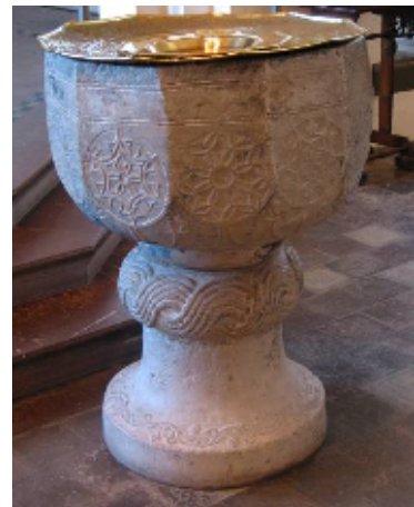
Kyrkans äldsta dopfunta är en så kallad nodfunta, daterad till perioden 1415-1425.

Under 1400-talets senare hälft utvidgades kyrkan med ett sidoskepp i söder och sakristia i norr. Södra utbyggnaden medförde att vapenhuset till det yttre förenades med sidoskeppet (fast till det inre var vapenhuset av murar åtskilt från kyrkorummet fram till 1600-talet). Valv på murade pelare slogs över mittskeppet, medan södra sidoskeppets valv förankrades i de samtidigt tillkomna väggarna. Troligen dekorerades kyrkorummets valv och väggar med muralmålningar, varav fragment återstår. Tornet förhöjdes med tegelmurar, prydda med blindingar.