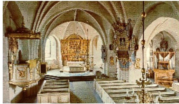
Kyrkan återfick sluten bänkinredning 1949-51. Medeltida kalkmålningar restaurerades, liksom draperimålningen bakom Wihelm Schæys epitafium. Digital kopia av vykort från 1970

Den senaste stora upprustningen skedde 1994-95 efter arkitekt Jerk Altons program. Då lagades fasadernas breda fogar med rent kalkbruk och avfärgades i vitockra nyans. Järnfönstren målades med svart linoljefärg och kyrkportarna engelskröda. I kyrkorummet ommålades bänkinredningen med tempera i avsevärt varmare toner än förut. Under orgelläktaren borttogs bänkar för att få ett öppet ”kyrktorg”. Norra sidoskeppet nyinreddes till sidokapell med lösa stolar och ett flyttbart bordsaltare. Bakom kapellet placerades det före detta korskranket från 1628, som avskärmning runt ett litet väntrum. Ny belysning med mässingsskärmar sattes upp under orgelläktaren.