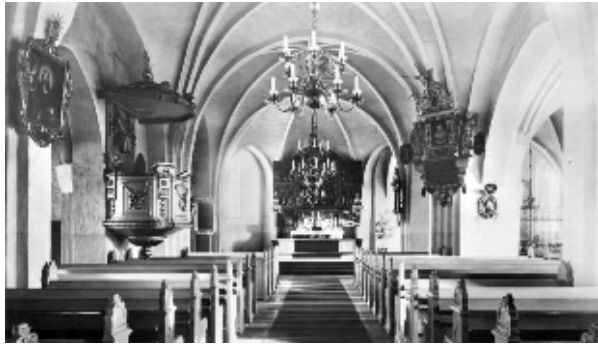
Kyrkorummet hade under 1900-talets första hälft öppna bänkrader, insatta vid 1904-05 års förnyelse. Valv och väggar saknade dekormålningar. Digital kopia av vykort från omkring 1900

Södra sidoskeppets kororgel installerades 1969-70. Vid omläggning av yttertaket 1978 ersattes de då 90-åriga järnplåtarna med koppar.