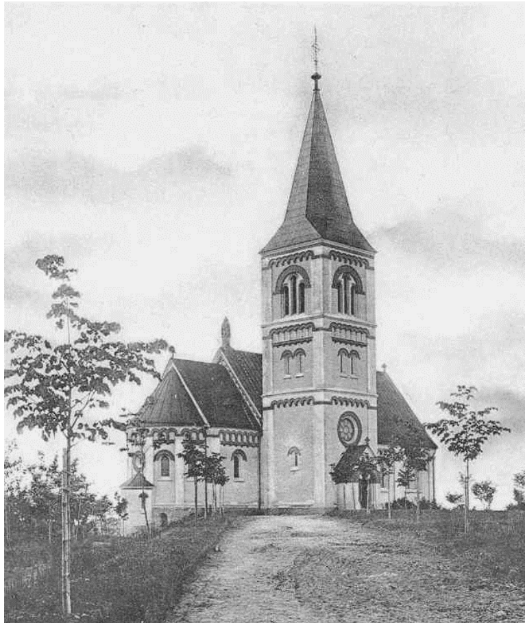
Kyrkan fotograferad kort efter att den var färdigställd - digital kopia av vykort

Hösten 1890 lades grunden till Sura Nya kyrka. Det egentliga byggandet kom igång följande vår. Grunden murades av stora sprängstensblock, väggarna av tegel ”stänkrappades” med kalkcementbruk och avfärgades i en gulröd nyans. Oputsade överstycken av extra hårdbränt tegel krönte ursprungligen fönsteröppningarna. Synlig tegelmur förekom även i rundbågsfriser under takfoten och mitt på tornet. I fönstren sattes bågar av gjutjärn, med färgat glas. Taket täcktes med svartmålad järnplåt från Surahammars bruk, där också tornspiran tillverkades. Kyrkan stod färdig sommaren 1892.