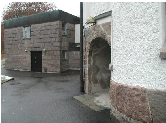
Ovan: Nuvarande bårhus tillbyggdes 1968-69. Till höger: västra förstugan - Digitalfoton Alton arkitekter AB

Sura nya kyrka omfattar långhus med torn byggt i nordväst, absid i nordost och i söder en lägre, långt senare tillbyggd del för bisättningar, mindre gudstjänster och sakristia. Grunden är murad av stora sprängda stenblock och väggarna av tegel. Sockeln är hög och jämn, av kilad, tuktad granit. Ovan följer rikt artikulerade fasader; spritputsade väggfält omväxlande med slätputsade omfattningar, pilastrar och nyromanska rundbågsfriser. Fönsteröppningarna är också rundbågiga, högt sittande med bågar och karmar av svartmålat gjutjärn och små blyinfattade, färgade rutor. Ingångarnas små förstugor i norr och väster pryds av skulpterade kalkstensportaler, kring dörrar av fernissad ek. Tornet har en spetsig spira täckt med ärggrön koppar, liksom långhusets brant sluttande sadeltak. På taket finns skorstenar inklädda med bly. Den utbyggda delen i söder har oputsade gråstenväggar mot norr och öster, putsade mot väster, samt ett flackt koppertak.