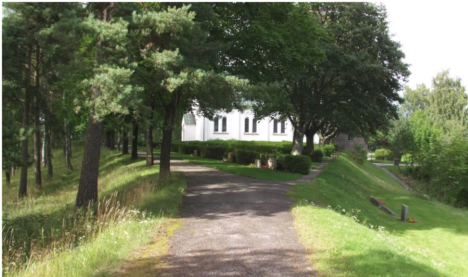
Södra infarten till kyrkogården följer en tidigare landsvägssträckning. Vägen lades om inför kyrkobygget 1890-92

Sura kyrkplats ligger två kilometer väster om Surahammars brukssamhälle, uppe på Strömsholmsåsen. Närmast omgivande kyrkogård är långsträckt i nord-sydlig riktning. Nedanför mot norr finns en äldre, muromgärdad kyrkogård som tillhörde Sura gamla träkyrka, av vilken bara den spånklädda sakristian återstår efter en förödande brand 1998. Mellan de båda kyrkorna låg församlingens prästgård fram till 1995. Nedanför östra åsslutningen vidtar stranden mot Östersjön. Området har avgränsats som riksintresse för kulturmiljövården.