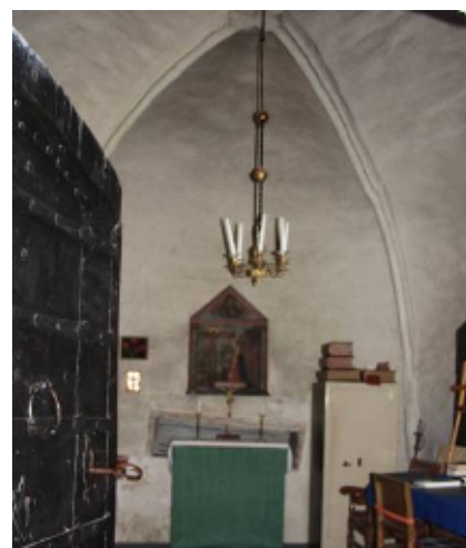
Sakristians valv slogs omkring 1300. I fonden ses ett andaktsaltare från 1962 och därbakom en brädfodrad nisch, murad 1696

muren finns en brädfodrad förvaringsnisch. Dolt under en heltäckningsmatta ligger ett trägolv av breda, kilsågade bräder, fastsatta med smidd spik. I norra delen ligger handslaget tegel. Mitt i rummet finns en lucka ner till en gammal vinkällare. Möbleringen består av förvaringsskåp, ett litet andaktsaltare och en skrivplats.