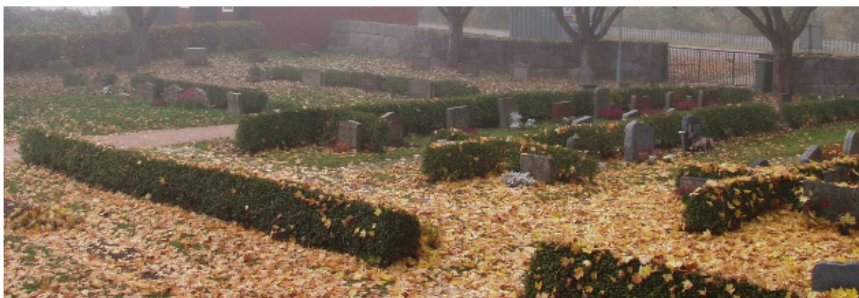
Kyrkogårdens nyare del som invigdes 1951 är tidstypisk, i klar kontrast till den äldre, 1800-talspräglade.

Den nyare delen i söder, invigd 1951, avgränsas med en mur mot vägen i väster och häck på övriga sidor. Gravkvarteren har indelats med låga rygghäckar av liguster. Samtliga gravar här är gräsbevuxna och gravstenarna genomgående låga och mer enhetligt utformade. Längst i söder finns ett litet bårhus, byggt 1951 efter ritningar av arkitekt Ärland Noréen som även svarade för den nyare kyrkogårdens planering.