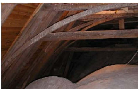
Kyrkan har 25 medeltida takstolar, varav 15 intakta