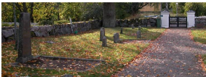
Kyrkogårdens norra del – digitalfotografier Svensk Klimatstyrning AB

Kyrkogårdens äldre del avgränsas med en mur som fick nuvarande utseende vid omläggning på 1860-talet. Gravstenarna uppvisar stor individuell variation. Området är till större delen gräsbevuxet, men runt några gravar finns bevarade grusbäddar, stenramar, i några fall även järnhägnader.