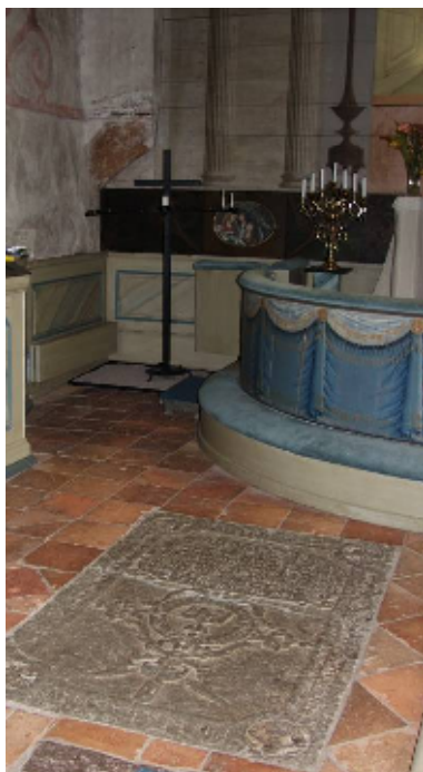
Korets norra sida – digitalfoto Svensk Klimatstyrning AB

Korets golv är i nivå med övriga kyrkorummet, men avviker då det består av lokalt tillverkat, handslaget tegel, samt gravhällar av kalksten. Östra väggen är klädd med liggande hyvlad panel. Den utgör underlag för altartavlan, en avbildad rundbåge buren av kolonner med joniska kapitäl. Rundbågen inramar gavelns stora fönster, vars antikglas mattfernissats. Norra och södra väggens kalkmålningar från 1611 skildrar Jesu livsträd, med motiven inramade av röda beslagsornament. Altaret intill väggen är byggt av trä med framskjutet, rundat mittparti. Framförvarande altarring är halvcirkelformig, sluten och dekorerad med en draperimålning i guld och blått.