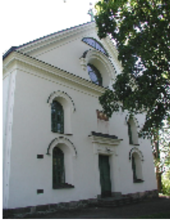
Norra gaveln

Västanfors kyrka har ett stort enskeppigt långhus med torn i söder. Ett smalare, rundat kor i norr är inbyggt bakom en utbyggnad i två våningar med smårum och en förstuga. Utifrån uppfattas långhuset därmed som att dess kor är rakslutet. 1 Kyrkan är murad av gråsten med tegel i muröppningarna frånsett tornets översta våning som enbart består av tegel.