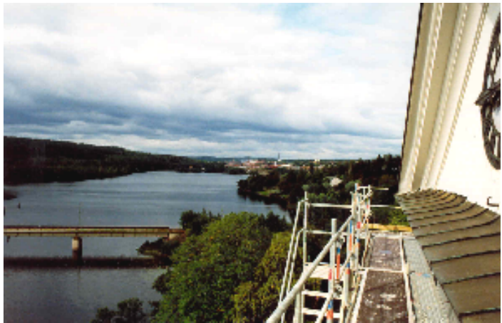
Utsikt från kyrktornet norrut över sjön Kratten, med Fagersta bruk i bakgrunden

Tätorten Fagersta har sin bebyggelse samlad dels vid Fagersta bruk i nordväst, dels vid Västanfors station i sydost. Kyrkplatsen och före detta Västanfors bruksherrgård - idag hembygdsgård - ligger i de södra utkanterna av tätortsbebyggelsen. Kyrkan med omgivande kyrkogård är belägna ovanför en brant sluttning på östra sidan om sjön Kratten, där Kolbäckån/Strömsholms kanal vidtar. Området är klassat som riksintresse för kulturmiljövården.