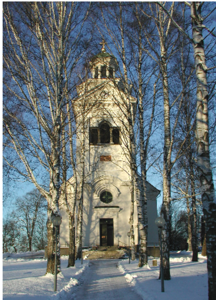
Gången rakt söderifrån fram till kyrkan anlades 1890-92, vid en större förnyelse och utvidgning av kyrkogården. Kyrkans yttre ingångstrappa med ramp tillbyggdes 1988

Långhuset har ett sadeltak täckt med falsade svarta plåtar i skivtäckning, medan tornets och lanterninens tak är kopparklädda.