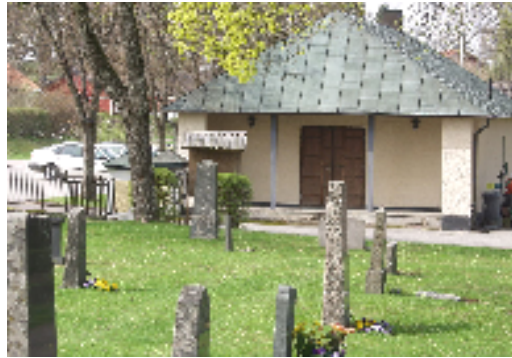
Bårhuset nyputsades 1997

På den äldre delen av kyrkogården växer många gamla ädellövträd, samt i några av kvarteren paradisäppelträd och tujor. På den nyare kyrkogården är träden avsevärt yngre. Här har rumslighet skapats genom häckplanteringar mellan gravkvarteren. Bårhuset i sydväst är byggt 1960 efter ritningar av Jörgen Fåak.