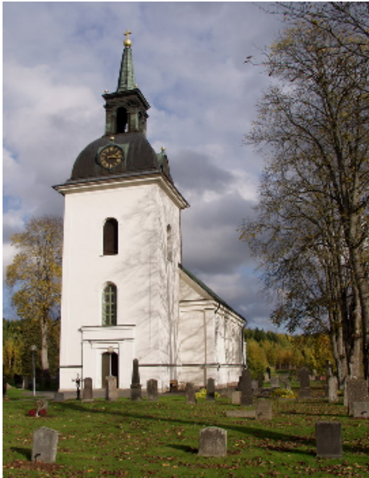
Kyrkans västtorn byggdes 1793-94, efter ritningar av byggmästare Eric Sjöström

Västervåla kyrka är enskeppig med kor i en smalare, rundad absid, samt västtorn. Långhuset har sockel av stora, tuktade stenar, medan tornets sockel har en yttre gjutning. Fasaderna är stänkputsade, vid senaste avfärgningen strukna med gulvit KC-färg. Långhuset har pilasterindelade väggfält, kraftigt profilerade sockel- och takgesimser och en slät list som rundar fönstrens ovansidor. Fönsteröppningarna är höga, rundbågiga och småspröjsade, målade med kromoxidgrön oljefärg och försedda med munblåsta rutor. En rejält tilltagen omfattning i nyklassisk stil markerar västportalen, vilken är stickbågig och försedd med kopparklädd pardörr. Långhuset har ett måttligt brant sadeltak täckt med kopparplåt. På tornet är en koppartäckt kupol, krönt av en öppen lanternin med åttakantig spira, förgylld kula och kors.