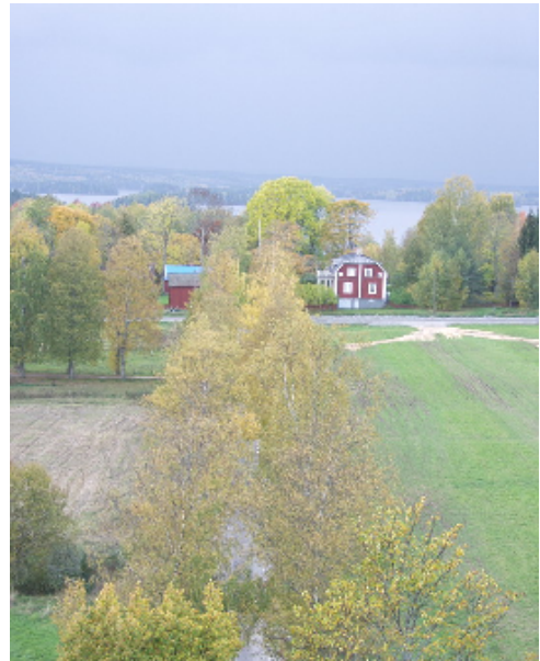
Kyrkallén, Västervåla före detta prästgård och i bakgrunden sjön Åmänningen

Mellan sjön och kyrkan ligger prästgården som ännu ger en relativt god bild av äldre tiders kyrkliga boställen. Huvudbyggnaden från 1760 har faluröda fasader och halvvalmat tak, plåttäckt sedan 1800-talet. En timrad tiondebod från 1700-talet står som flygel i sydost och på gårdsplanens motstående sida finns f d bykstuga/mangelbod. Närmast norr om kyrkan ligger kyrkans arrendatorsgård, kaplansboställe fram till 1852, som under senare hälften av 1800-talet fyllde olika sockenkommunala funktioner.