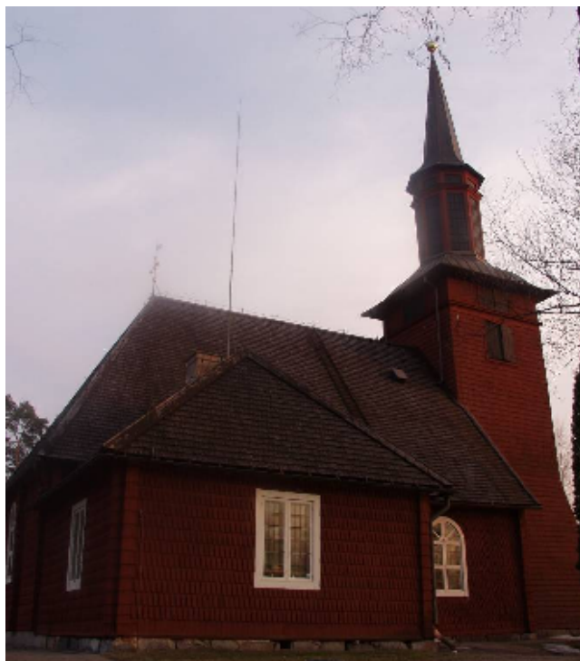
Kyrkans faluröda fasader har tidigare varit strukna med tjärblandad rödfärg. Sockeln av sten från bergtäkt lades vid en stor upprustning 1914-15.

Kyrkobyggnaden omfattar ett rektangulärt långhus med vidbyggd sakristia i norr, samt västtorn. Sockeln består av sprängd granit i kallmur. Långhus och sakristia har timmerstomme och spåntäckta sadeltak, valmade över norra respektive östra gaveln. Tornet är stolprest, har en konisk bas och är spånklätt frånsett klockvåningen som är brädfodrad. Över klockvåningen är ett karnissvängt, koppartäckt tak, en brädfodrad lanternin med blindfönster och en konisk, kopparklädd spira. Kyrkans faluröda fasader består till stor del av kluvna näbbspån, uppsatta med smidd spik. På östra gaveln förekommer ramsågade spån och på sakristian klingsågade – uppsatta vid nyligen gjord reparation. Fönsteröppningarna är rundbågiga i långhuset och rektangulära i sakristian, försedda med blyinfattade, grönskimmerande rutor, smidda beslag och gångjärn. Porten i väster är klädd med svartmålad panel i fiskbensmönster.