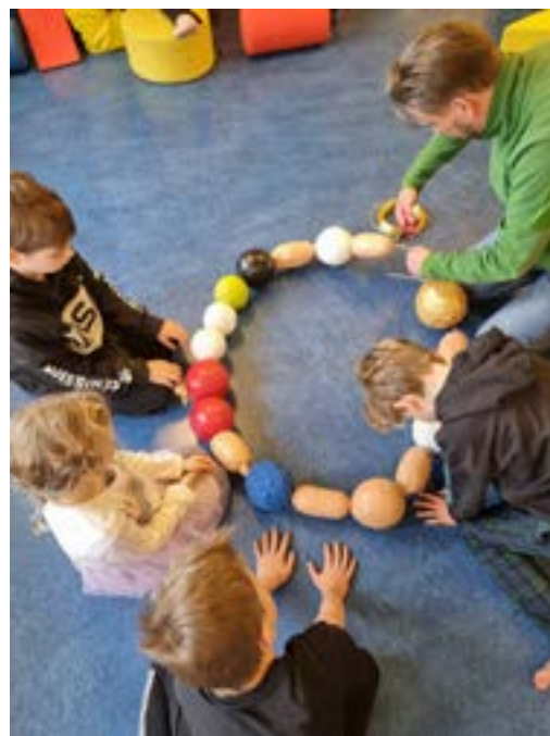
Estetiskt projekt utifrån boken "Martin och Frälsarkransen".

www.svenskakyrkan.se/saro/fritidshemmet-lyktan