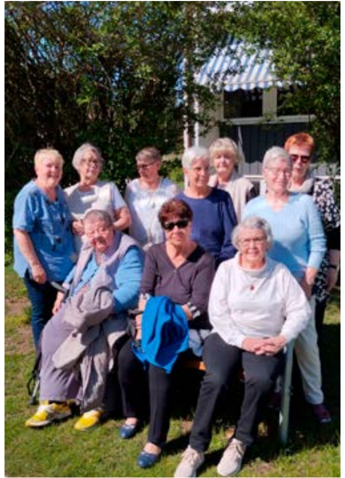
Utflykt till Jämshögs folkhögskola 7 maj

Mitäpä, jos tänä syksynä juhlimme meidän 53 vuotista suomenkielistä seurakuntatyötä? Onko sinulla valokuvia tai omakohtaisia muistoja seurakunta tapahtumista, jotka voisit tuoda mukana 13/10 pidettävään jumalanpalvelukseen ja Nostalgia Juhlaan. Näin voisimme yhdessä muistella kaikkea sitä mitä seurakuntatyömme on ollut.