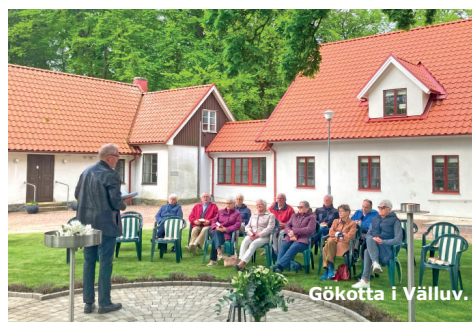
Gökötta i Välluv.