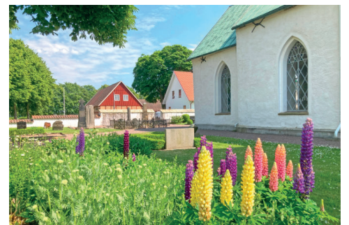
Sommarblommor vid Välluvs kyrka.