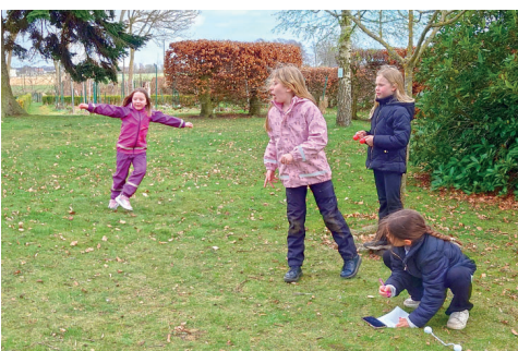
Lek i vildmarkskyrkan i Välluv.