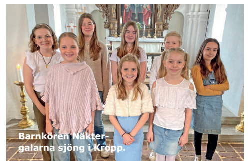
Barnkören Näktergalarna sjöng i Kropp.