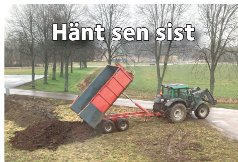
Ytan runt expeditionen i Välluv har iordningstälts.