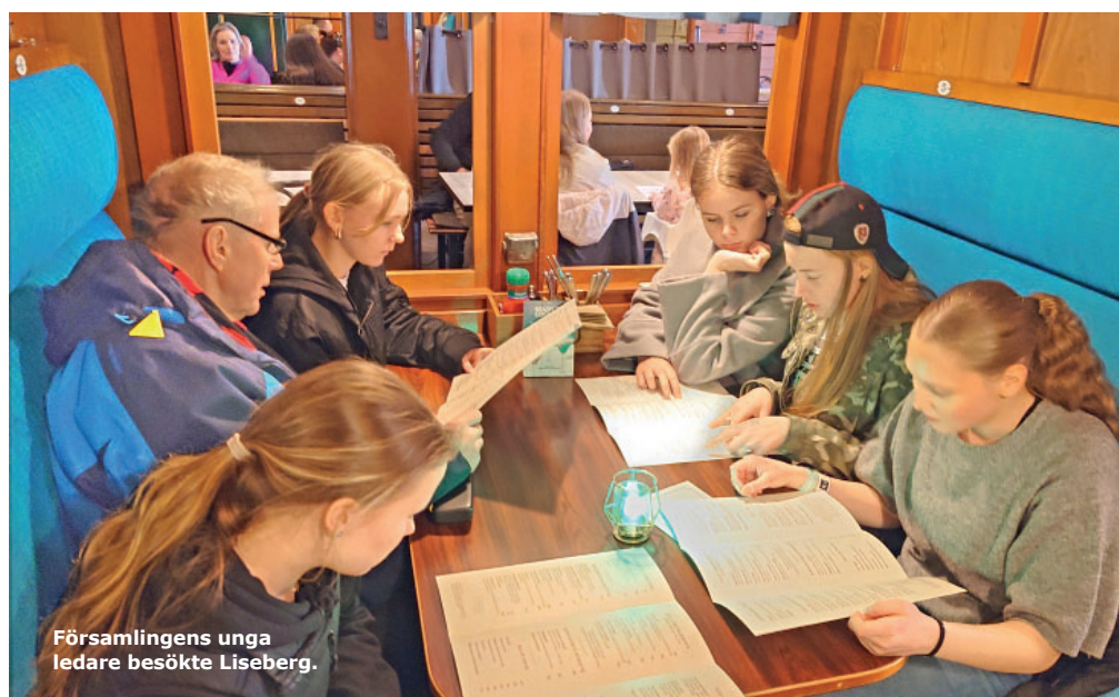
Församlingens unga ledare besökte Liseberg.