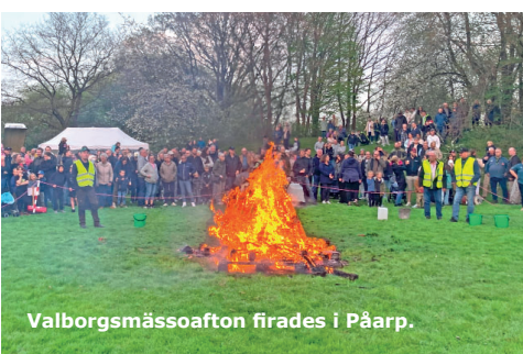
Valborgsmässoafton firades i Påarp.