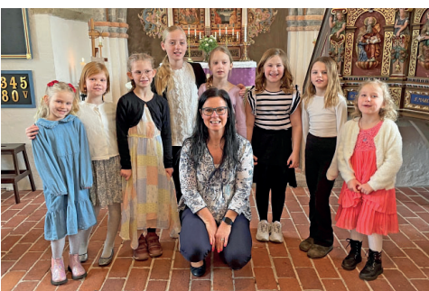
Barnkörerna från Möarp sjöng på palmsöndagen.