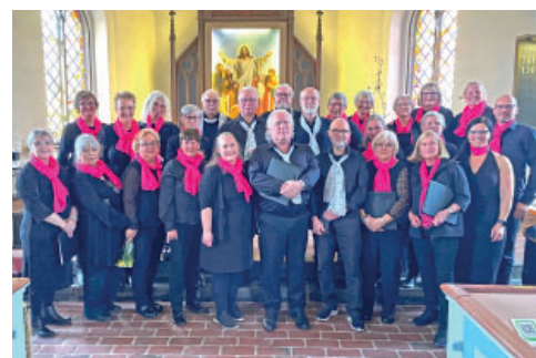
Björkakören gav ett program i Ekeby.

Ta med ditt eget arbete/material så hantverkar vi och inspirerar varandra. Tillsammans löser vi det mesta. Kaffe/te bjuder vi på och vill man ha något litet att äta till finns det för en liten peng. Start 16 september.