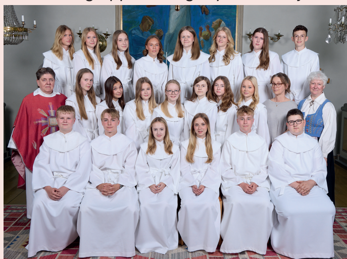
Mariagruppen i Horns kyrka 25 maj