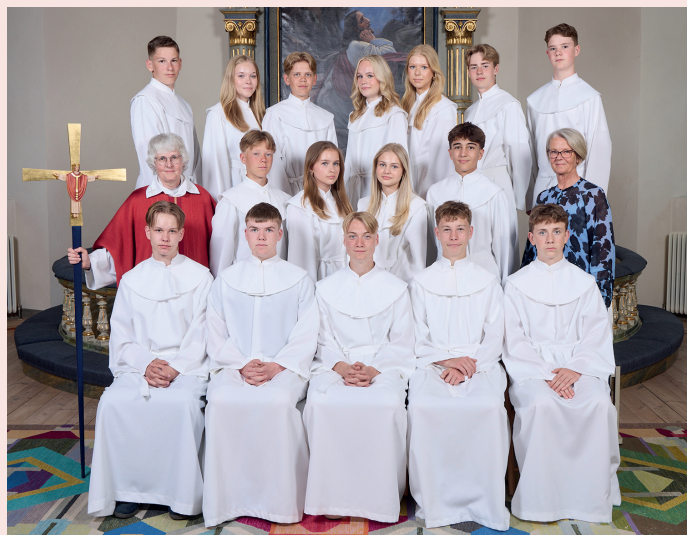
Saragruppen i Bergs kyrka 25 maj