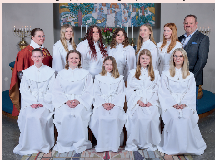
Rutgruppen i Värings kyrka 19 maj