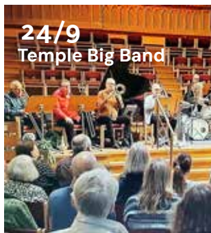
24/9 Temple Big Band