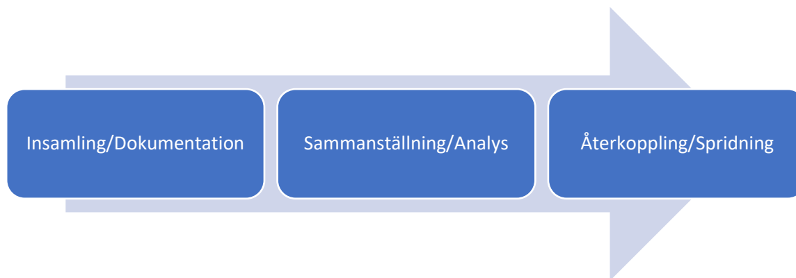
Figur: Sekvensen Insamling- Analys-Återkoppling

De olika delarna motiverar och förstärker varandra. Alltför lösa kopplingar eller avbrott – en stiftsdiakon benämner det ”glapp” – riskerar sjunkande motivation, låg validitet och minskad eller utebliven praktisk nytta. En betydelsefull fråga för denna kunskapande sekvens är därför vilka av alla de aktörer som noterats i denna rapport som har ansvar för vad. Vi påminner om att ”återkoppling” bör förstås som ett utbyte inbäddat i en ömsesidig relation.