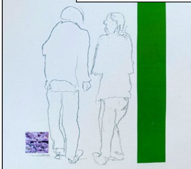
Bild och text: Hans Kvarnström. Följ Dagdroppar på Instagram eller bloggen universitetskyrkankarlstad.blogspot.com om du vill se fler.

Att mötas i de goda samtalen kan få nya vägar att visa sig, nya svar att hitta nya frågor till, nytt hopp att växa och blomma i.