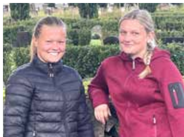
Emma och Elsa