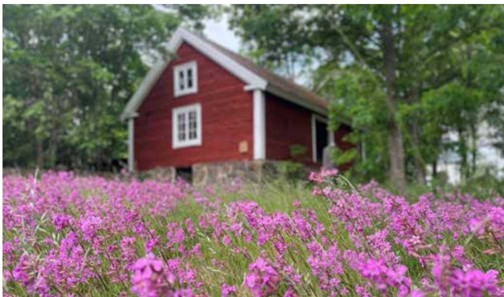
Blomstrande ängsmark på Vislanda kyrkogård i juni 2024.