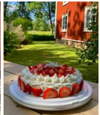
Midsommarfirande i Skeppshult -sommar, tårta och förundran!