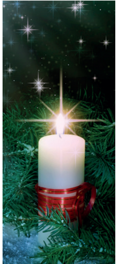
Franz Gruber, österrikisk lärare och organist skrev musiken till Stille Nacht, heilige natt, Stilla natt.