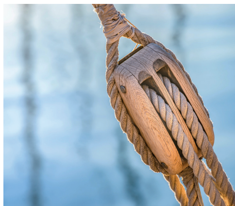
Liksom taljan är samtalet ett sätt att öka kraften och orken att bära.

K ontaktuppgifter till präster och diakoner i församlingen finner du på sidan 2. Skulle du behöva någon att tala med då dessa inte är anträffbara kan du mellan 22.00–06.00 alltid ringa Jourhavande präst på telefon 112.